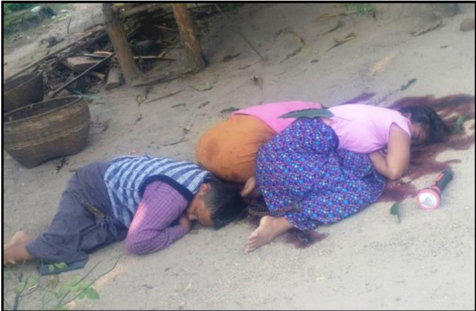
မြိုင်မြို့နယ်၊ မြို့စိုး(တ)ကျေးရွာ၌ အကြမ်းဖက်အဖွဲ့မှ ရက်စက်စွာ သတ်ဖြတ်ခံခဲ့ရသည့် နိုင်ငံ့ဝန်ထမ်းကောင်းမိသားစုဝင် ၃ ဦး