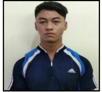
တရားခံ အောင်မြင့်မြတ်