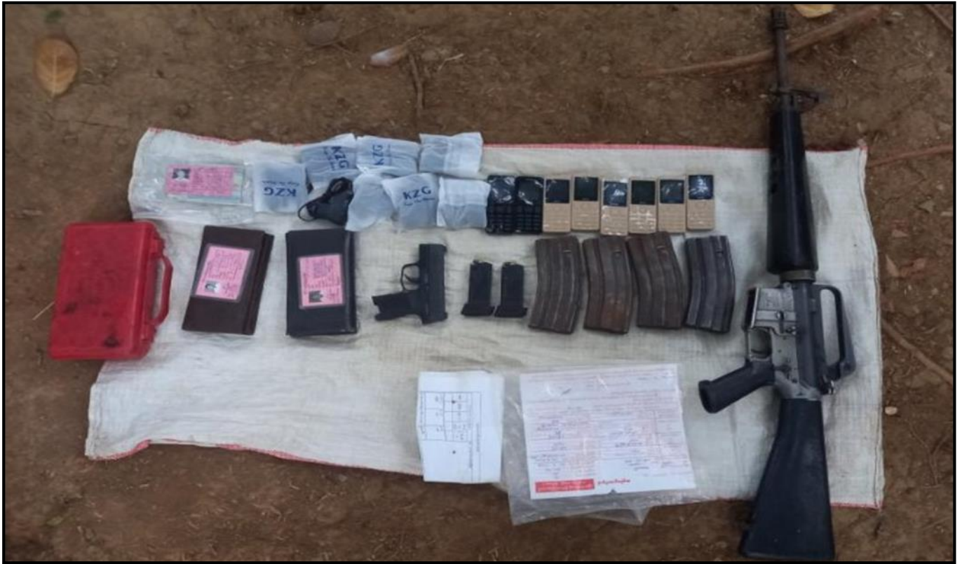
ဗဟိုတောမြို့နယ်၊ ဂုံးညှင်းတန်းအုပ်စု လဲလောင်းကျေးရွာအနီး ခြေတော်ရာဘုန်းကြီးကျောင်း၌ သိမ်းဆည်းရမိသည့် လက်နက်၊ ခဲယမ်းများ

အပြင် ဗုဒ္ဓဘာသာအား ကိုးကွယ်ယုံကြည်ကြသည့် တိုင်းရင်း သားပြည်သူအများစုကလည်း စိတ်အနှောက်အယှက်ဖြစ်ပေါ် လျက်ရှိပါသည်။ နိုင်ငံတော်တွင် မိမိတို့ကိုးကွယ်ယုံကြည်သည့် ဘာသာတရားအပေါ် လွတ်လပ်စွာကိုးကွယ်ယုံကြည်ခွင့်ကို အခြေခံဥပဒေတွင် ထည့်သွင်းပြဋ္ဌာန်း၍ ခွင့်ပြုထားပြီးဖြစ်ပါ သည်။ ယခုကဲ့သို့ ဘာသာရေးခုတုံးလုပ်၍ မြန်မာနိုင်ငံသူ၊ နိုင်ငံ သားများအများစု ကိုးကွယ်ရာ၊ ယုံကြည်ရာ ရဟန်းသံဃာများ