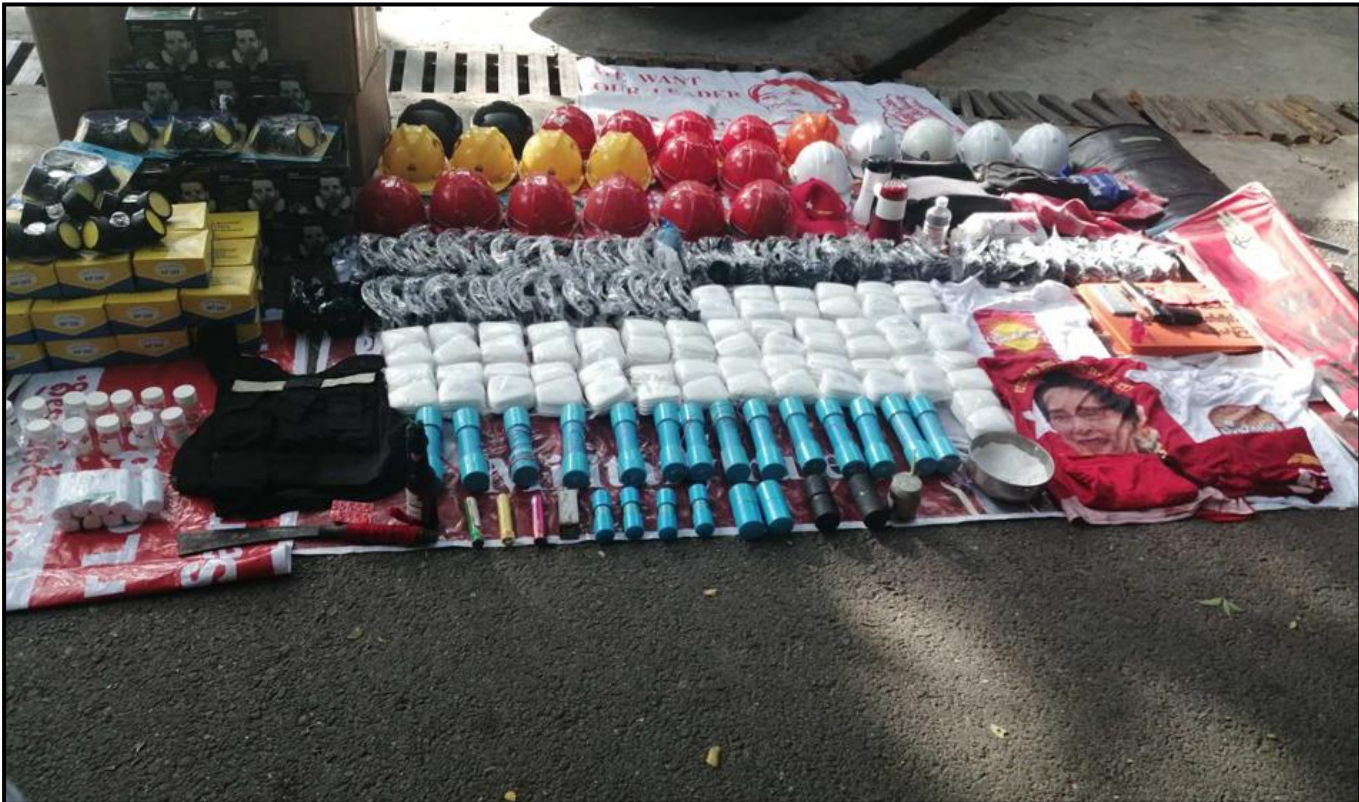
မဟာအောင်မြေမြို့နယ်ရှိ မြဲတောင်ဘုန်းကြီးကျောင်းတိုက်အတွင်းမှ သိမ်းဆည်းရမိသည့် အကြမ်းဖက်ရာတွင်အသုံးပြုသည့် ဆက်စပ်ပစ္စည်းများ