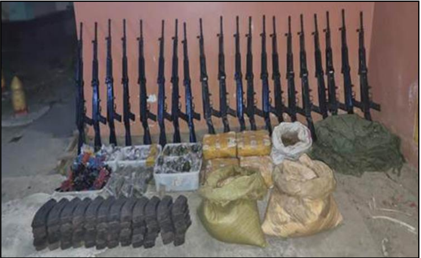
စဉ့်ကူးမြို့နယ်၊ ခူလယ်ကျေးရွာရှိ မဏိဇောတိက ဘုန်းတော်ကြီးကျောင်းဝန်းအတွင်းမှ သိမ်းဆည်းရမိသည့် လက်နက်၊ ခဲယမ်းများ

ချက်အရ ဒီဇင်ဘာ ၈ ရက်တွင် အဆိုပါကျောင်းတိုက်၏ ဆွမ်းစား ဆောင်အနောက်ဖက်၊ မြေကြီးအတွင်းမြှုပ်နှံထားသော KA သေနတ် ၂၀ လက်၊ ၎င်းကျည်အိမ် ၆၀ ခု၊ ၎င်းကျည် ၇,၀၀၀ တောင့်၊ လက်ပစ်ဗုံး ၉၇ လုံး၊ အီနာဂါ ၅ ငှ လုံး၊ လျှပ်စစ်စနက်တံ ၃၀၀ ချောင်း၊ ယမ်းမှုန့် ၁၅ ပိဿာခန့်၊ သေနတ်လွယ်ကြိုးနှင့် အီကွေးမန် ၂၀ ခုစီတို့အား သိမ်းဆည်းရမိခဲ့။