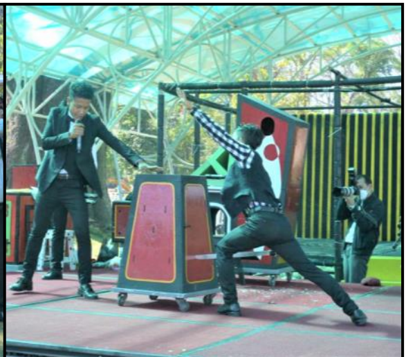
နိုင်ငံတော်ဝန်ကြီးချုပ်နှင့် အဖွဲ့ဝင်များက နယ်လှည့်ပြည်သူ့ဆက်ဆံရေးတပ်ဖွဲ့မှ မျက်လှည့်ပြဿမှုပြကွက်များအား ကြည့်ရှုအားပေးစဉ်