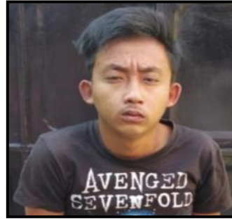
တရားခံ ရဲဝင့်ကျော်