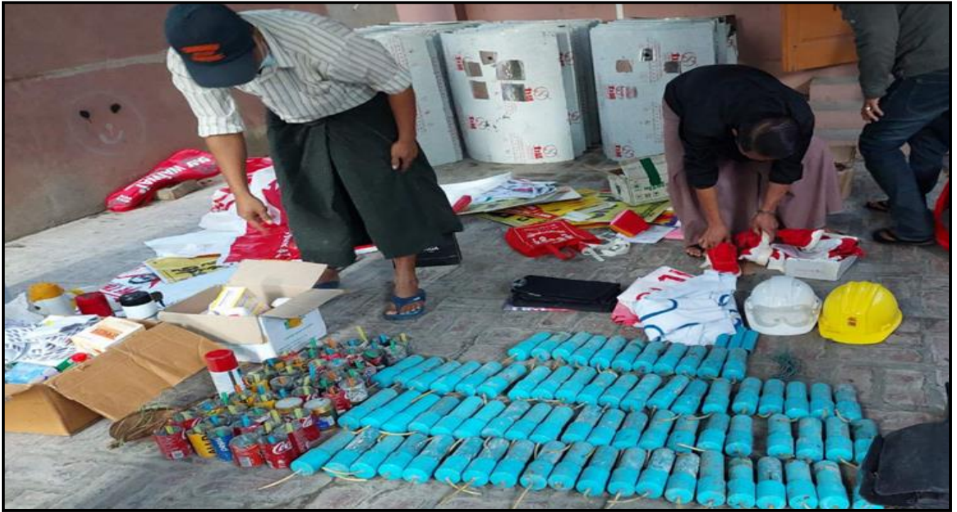
ချမ်းအေးသာစံမြို့နယ်အတွင်း Silence Strike Campaign ပြုလုပ်ရန် ပြင်ဆင်နေသူထံမှ သိမ်းဆည်းရမိသည့် လက်လုပ်မိုင်းများနှင့် ဖောက်ခွဲရေးဆက်စပ်ပစ္စည်းများ

ကြိုးကိုင်စေခိုင်းမှုများကြောင့် အစွန်းရောက် NLD ထောက်ခံသူလူငယ်များ လမ်းမှားရောက်ရှိပြီး အမျိုးမျိုးသောအကြမ်းဖက်လုပ်ရပ်များကို မိုက်ရှူးရဲဆန်စွာ ပြုလုပ်လျက်ရှိပါသည်။ အကြမ်းဖက်သမားများသည် ဘက်မတူလျှင် ငါ့ရန်သူဟု သတ်မှတ်ကာ အပြစ်မဲ့ပြည်သူများအား ရက်စက်စွာ လုပ်ကြံသတ်ဖြတ်လျက်ရှိခြင်းကြောင့် ပြည်သူလူထုအနေဖြင့် အကြမ်းဖက်သမားများအား အမြန်ဆုံးဖမ်းဆီးရမိရေးအတွက် လုံခြုံရေးတပ်ဖွဲ့ဝင်များနှင့် ပူးပေါင်း၍ ဆောင်ရွက်လျက်ရှိပါသည်။