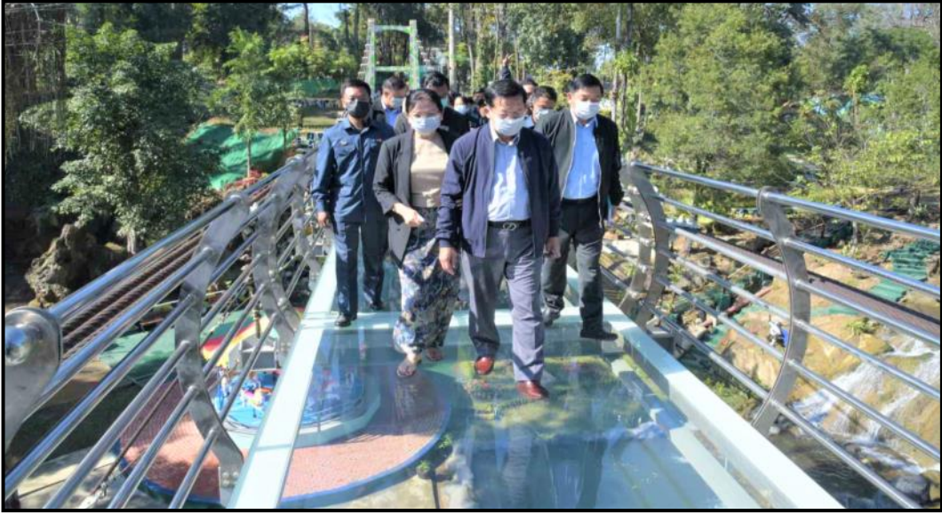
နိုင်ငံတော်ဝန်ကြီးချုပ်နှင့်အဖွဲ့ဝင်များက နိုင်ငံတကာအဆင့်မီ LED မှန်တံတားပေါ်မှ ဖြတ်သန်းကြည့်ရှုနေမှု