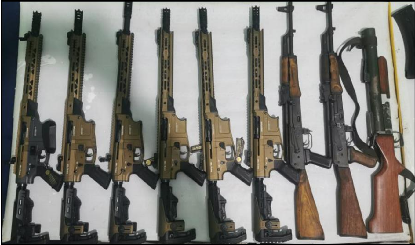
ပဲခူးမြို့၊ ဥဿာမြို့သစ်၊ ရပ်ကွက်ကြီး(၈)၊ ဓမ္မဒူတသီလရှင်ကျောင်းတွင် သိမ်းဆည်းရမိသည့် လက်နက်/ခဲယမ်းများ