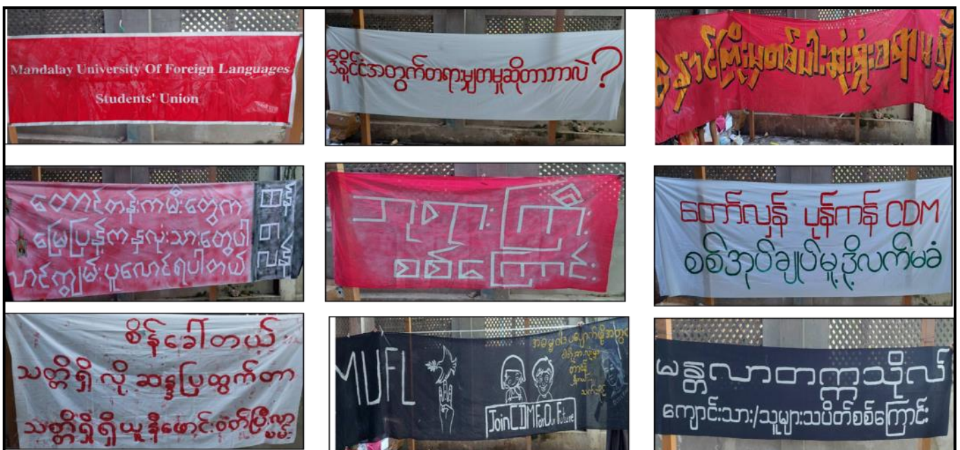
Silence Strike Campaign ပြုလုပ်ရန် လှုံ့ဆော်ရေးသားထားသည့် ဆိုင်းဘုတ်များ၊ ဝိုစတာများ