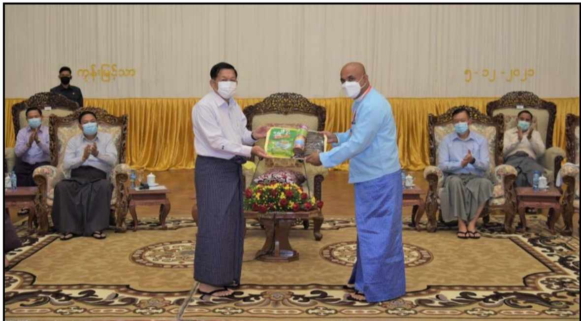
နိုင်ငံတော်ဝန်ကြီးချုပ်က အစ္စလာမ်ဘာသာအသင်းမှ ဦးအောင်ဇော်ဝင်းအား စားသောက်ဖွယ်ရာများ ပေးအပ်နေမှု