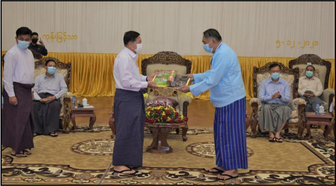
နိုင်ငံတော်ဝန်ကြီးချုပ်က ဘာသာပေါင်းစုံချစ်ကြည်ညီညွတ်ရေးအဖွဲ့ (ဗဟို)ဥက္ကဋ္ဌ ဦးစိန်သန်းအား စားသောက်ဖွယ်ရာများ ပေးအပ်နေမှု