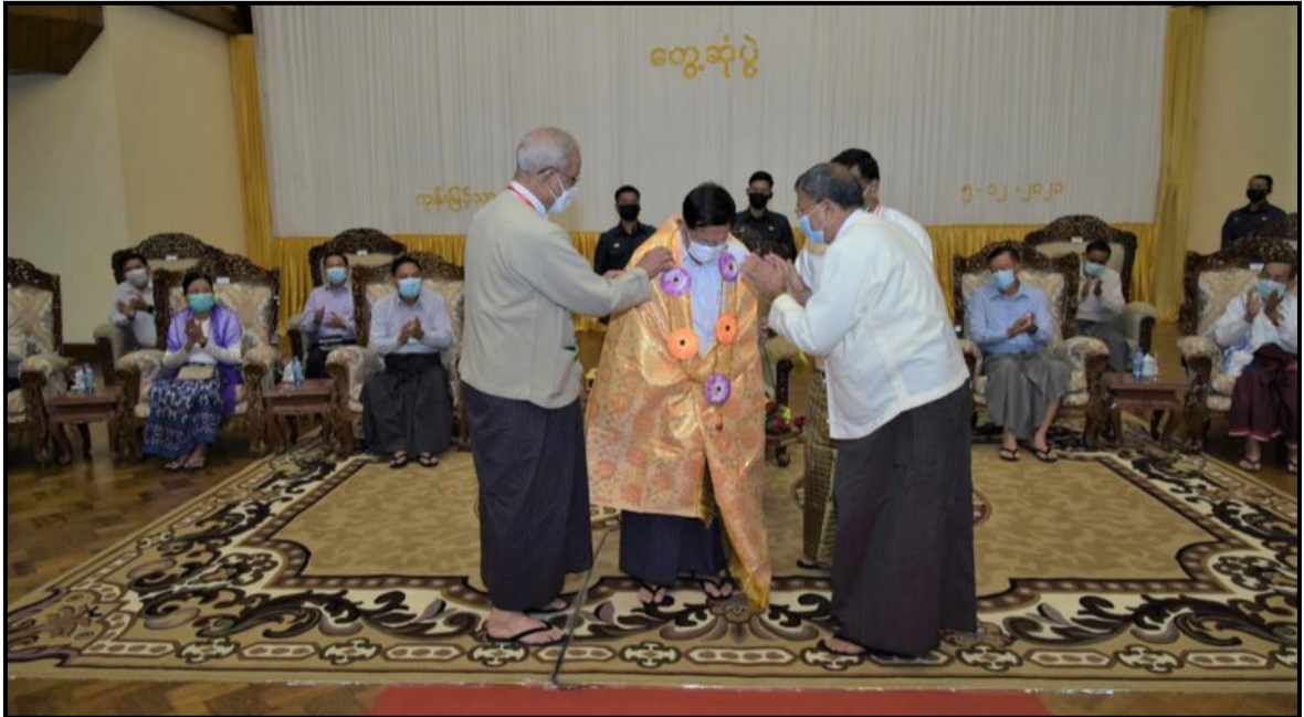
နိုင်ငံတော်ဝန်ကြီးချုပ်အား ဘာသာပေါင်းစုံချစ်ကြည်ညီညွတ်ရေးအဖွဲ့(ဗဟို)ဒုတိယဥက္ကဋ္ဌ ဟိန္ဒူဘာသာအသင်းမှ ဦးဇော်ဇော်နိုင်က ဟိန္ဒူရိုးရာ ဂုဏ်ပြုမင်္ဂလာပုဝါနှင့် မင်္ဂလာပန်းကုံးတို့ကို ဂုဏ်ပြုဝတ်ဆင်ပေးနေမှု

သာသနာရေးနှင့် ယဉ်ကျေးမှုဝန်ကြီးဌာန ပြည်ထောင်စု ဝန်ကြီး ဦးကိုကိုက မိမိတို့နိုင်ငံ၏ ဖွဲ့စည်းပုံအခြေခံဥပဒေ (၂၀၀၈)ခုနှစ်တွင် ခရစ်ယာန်ဘာသာ၊ အစ္စလာမ်ဘာသာ၊ ဟိန္ဒူ ဘာသာနှင့် အခြားနတ်ကိုးကွယ်မှုများကိုလည်း ကိုးကွယ်ရာ ဘာသာဟူ၍ အသိအမှတ်ပြုသည်ဟု ပါရှိသဖြင့် ဘာသာပေါင်းစုံ တို့၏ လိုအပ်ချက်များကို တတ်စွမ်းသရွေ့ ဖြည့်ဆည်းဆောင် ရွက်ပေးရန် မိမိတို့ဝန်ကြီးဌာန၌ တာဝန်ရှိပါကြောင်း ပြော ကြားခဲ့သည်။