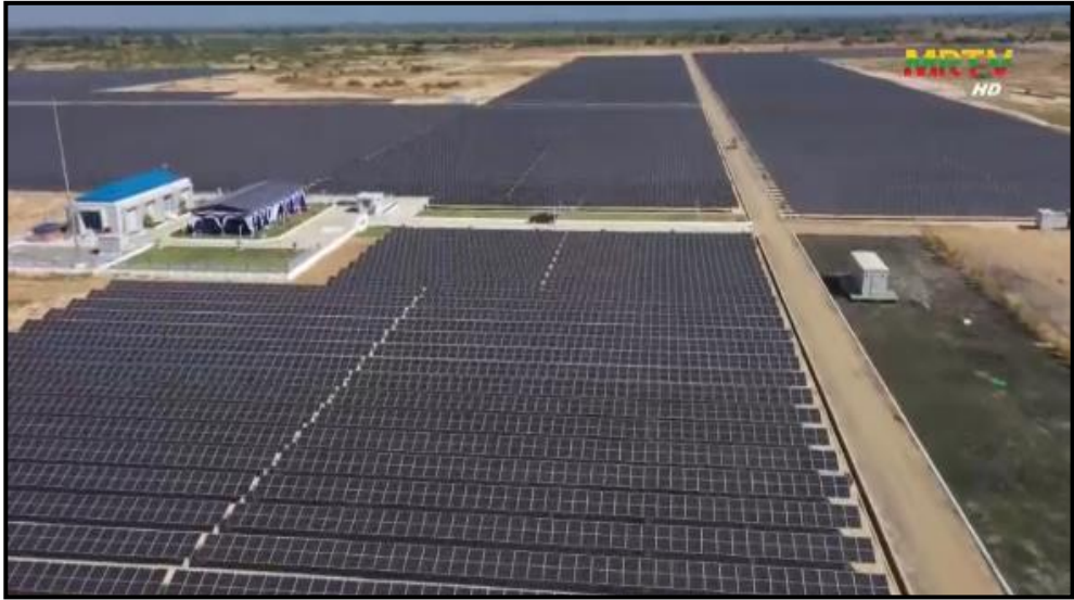
မန္တလေးတိုင်းဒေသကြီးအတွင်းရှိ မဂ္ဂါဝပ် ၃၀ သပြေဝ နေရောင်ခြည်စွမ်းအင်သုံးဓာတ်အားပေးစက်ရုံစီမံကိန်းကို တွေ့ရစဉ်

တော်ဓာတ်အားစနစ်သို့ ချိတ်ဆက်ပို့လွှတ်ဖြန့်ဖြူးသွားမည် ဖြစ်ကြောင်း။