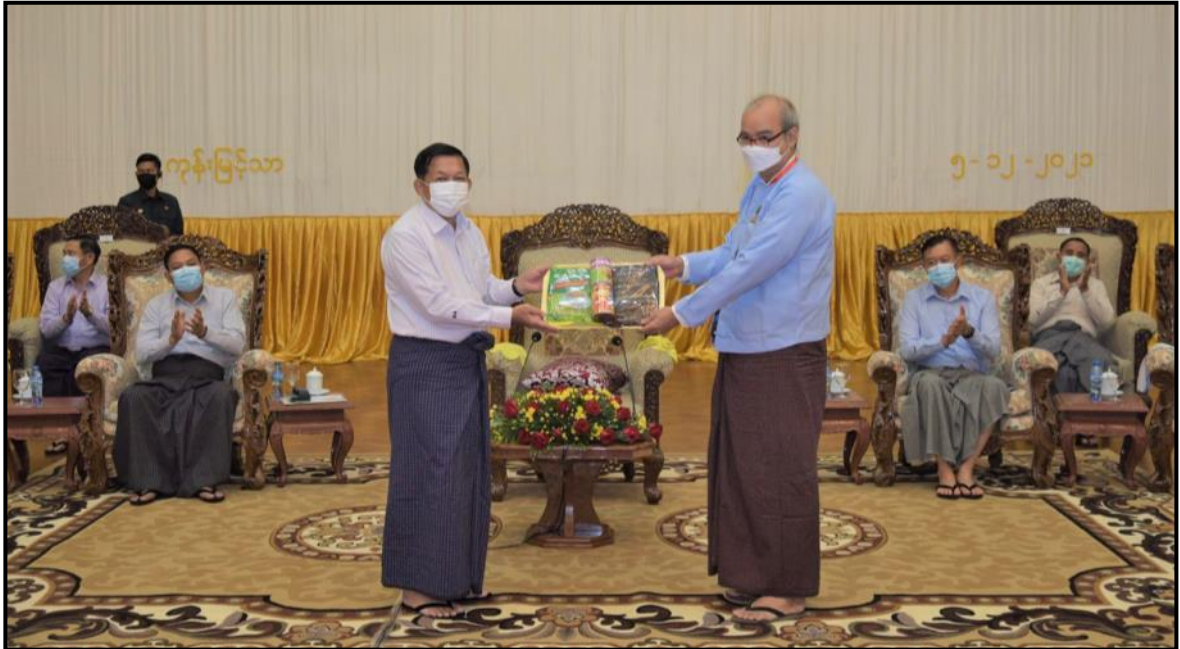
နိုင်ငံတော်ဝန်ကြီးချုပ်က ခရစ်ယာန်ဘာသာအသင်းမှ ဦးမိုးဇင်အား စားသောက်ဖွယ်ရာများ ပေးအပ်နေမှု