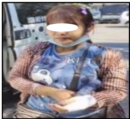
ကြည့်မြင်တိုင်မြို့နယ်အတွင်း လက်လုပ်မိုင်းပေါက်ကွဲမှုကြောင့် ထိခိုက်ဒဏ်ရာရရှိခဲ့သည့် အပြစ်မဲ့ပြည်သူ ၃ ဦး