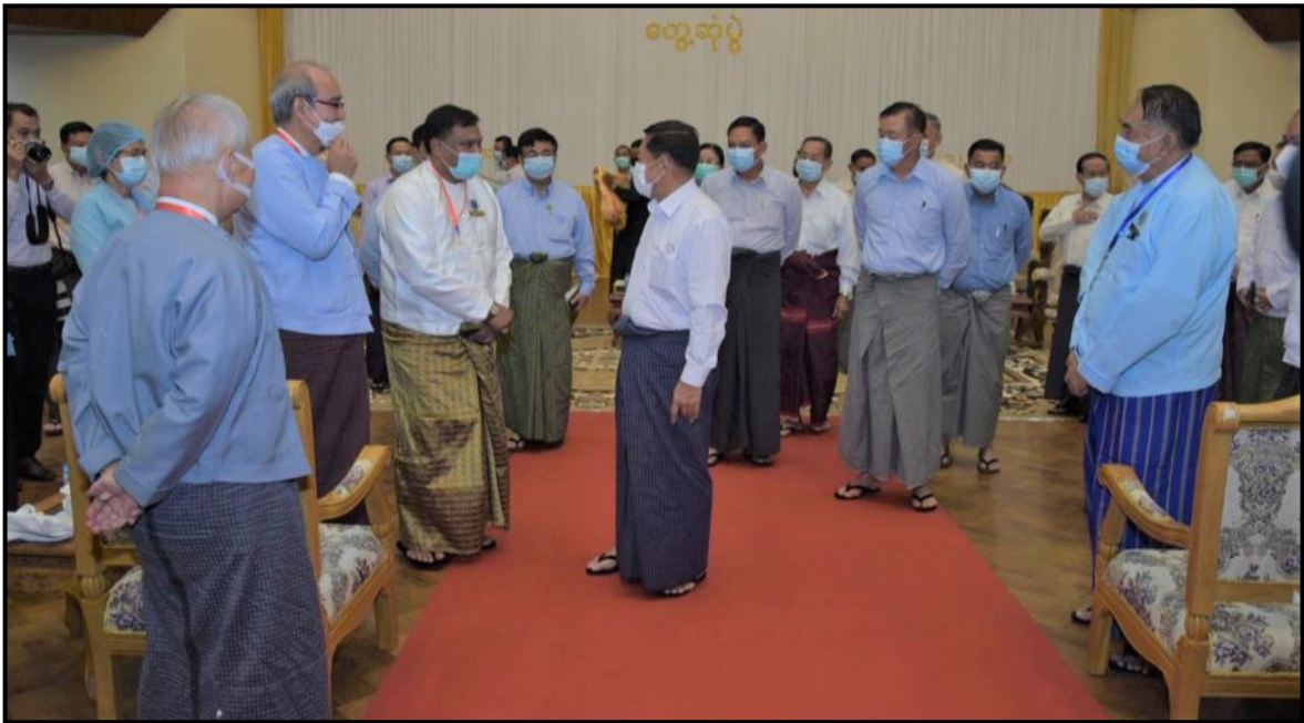
နိုင်ငံတော်ဝန်ကြီးချုပ်က ဘာသာပေါင်းစုံချစ်ကြည်ညီညွတ်ရေးအဖွဲ့ (ဗဟို)ဥက္ကဋ္ဌ ဦးစိန်သန်းနှင့် တာဝန်ရှိသူများအား ရင်းရင်းနှီးနှီးနှုတ်ဆက်နေမှု