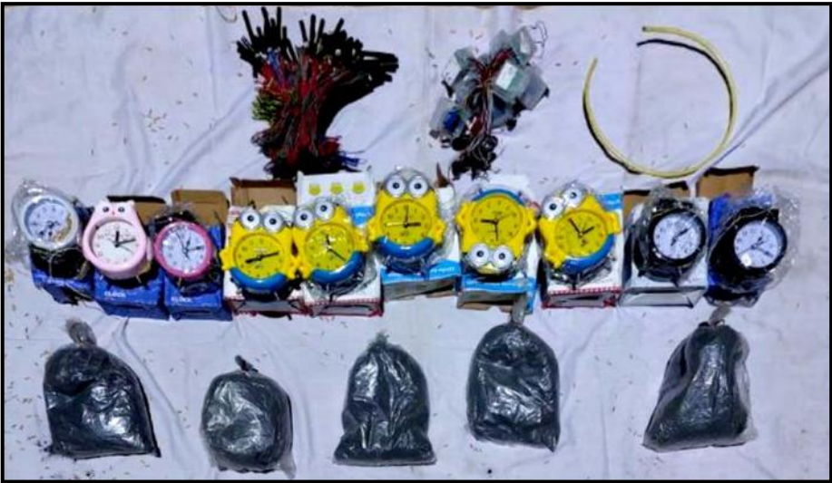
ပုသိမ်မြို့နယ်၊ (၁၀)ရပ်ကွက်၌ သိမ်းဆည်းရမိသည့် ဖောက်ခွဲရေးပစ္စည်းများ