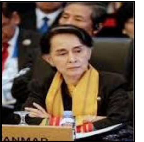
ဒေါ်အောင်ဆန်းစုကြည်