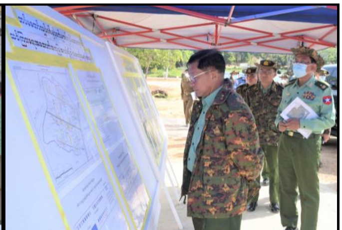
နိုင်ငံတော်စီမံအုပ်ချုပ်ရေးကောင်စီဥက္ကဋ္ဌ တပ်မတော်ကာကွယ်ရေးဦးစီးချုပ်က ခင်းကျင်းပြသထားသည့် ပစ္စည်းများနှင့် သင်ကြားရေးအထောက်အကူပြုအလုပ်ရုံ နေရာချထားမှုများကို လိုက်လံကြည့်ရှုနေမှု