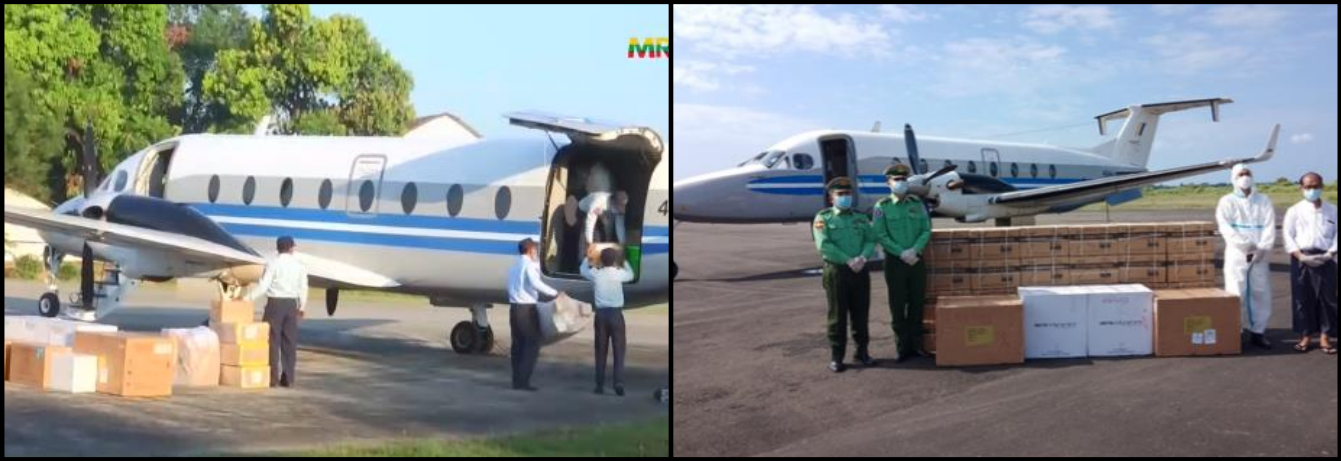
တိုင်းဒေသကြီးနှင့် ပြည်နယ်အသီးသီးသို့ ကိုဗစ်-၁၉ ရောဂါ ကာကွယ်ဆေးများကို သတ်မှတ်အအေးစံချိန်စံညွှန်းများနှင့်အညီ တပ်မတော်လေယာဉ်များဖြင့် ပို့ဆောင်ပေးနေမှု

ကိုဗစ်-၁၉ ရောဂါ ကာကွယ်၊ ထိန်းချုပ်၊ ကုသရေးလုပ်ငန်းများ ဆောင်ရွက်လျက်ရှိသော Quarantine Center များအား ဆက်လက်ဖွင့်လှစ်ပေးခြင်းနှင့် ကိုဗစ်-၁၉ ရောဂါ ကာကွယ်ဆေးထိုးပေးခြင်းတို့အား တိုင်းဒေသကြီးနှင့် ပြည်နယ်အသီးသီး၌ ဆက်လက်ဆောင်ရွက်လျက်ရှိပါသည်-