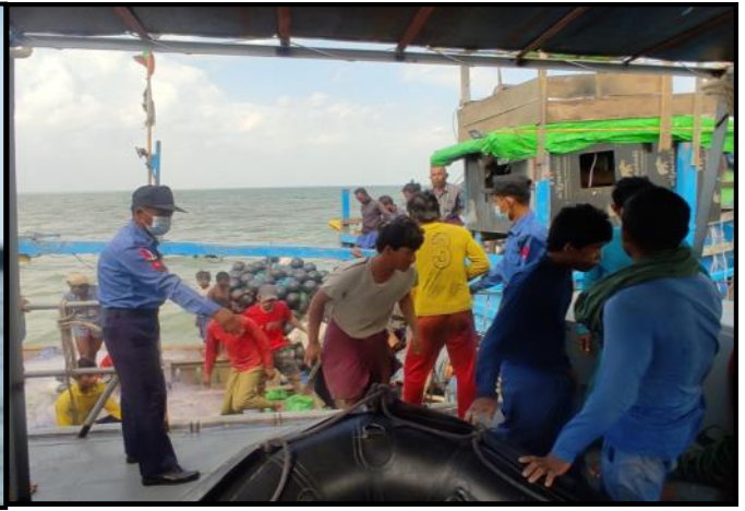
စက်ချွတ်ယွင်းမှုဖြစ်ပွားခဲ့သည့် ငါးဖမ်းစက်လှေမှ လှေသားများအား တပ်မတော်(ရှေ့)မှ တပ်မတော်သားများက ကူညီကယ်ဆယ်ရေးလုပ်ငန်းများ ဆောင်ရွက်နေမှု