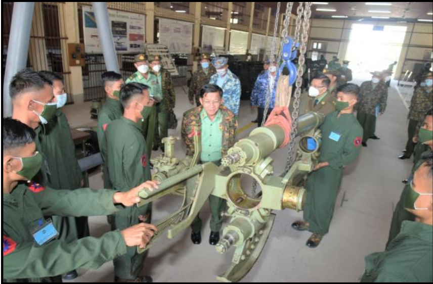
နိုင်ငံတော်စီမံအုပ်ချုပ်ရေးကောင်စီဥက္ကဋ္ဌ တပ်မတော်ကာကွယ်ရေးဦးစီးချုပ်က သင်တန်းသားများကိုယ်တိုင်လက်တွေ့ဆောင်ရွက်နေမှုကို ကြည့်ရှုစစ်ဆေးနေမှု

နိုင်ငံတော်စီမံအုပ်ချုပ်ရေးကောင်စီဥက္ကဋ္ဌ တပ်မတော်ကာကွယ်ရေးဦးစီးချုပ် ဗိုလ်ချုပ်မှူးကြီး မင်းအောင်လှိုင် ပြင်ဦးလွင်တပ်နယ်ရှိ နယ်မြေခံစက်မှု အင်ဂျင်နီယာသင်တန်းကျောင်းသို့ ကြည့်ရှုစစ်ဆေး