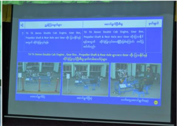
လျှပ်စစ်နှင့် စက်မှုအင်ဂျင်နီယာညွှန်ကြားရေးမှူးရုံး ညွှန်ကြားရေးမှူးက သင်တန်းကျောင်းအဆင့်မြှင့်တင်ဆောင်ရွက်နေမှုများကို ရှင်းလင်းတင်ပြနေမှု