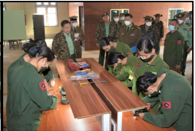
နိုင်ငံတော်စီမံအုပ်ချုပ်ရေးကောင်စီဥက္ကဋ္ဌ တပ်မတော်ကာကွယ်ရေးဦးစီးချုပ်က သင်တန်းသား/သူများ၏ စာတွေ့လက်တွေ့ သင်ခန်းစာများ သင်ယူနေမှုအခြေအနေများကို လိုက်လံကြည့်ရှုနေမှု