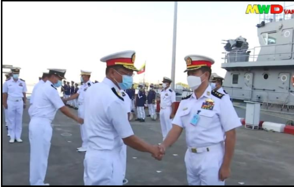
အာဆီယံ-ရုရှား ရေတပ်ဆိုင်ရာလေ့ကျင့်ခန်း ASEAN-RUSSIA Naval Exercise (ARNEX-2021) သို့ တက်ရောက်ခဲ့သော တပ်မတော်(ရေ)မှ စစ်ရေယာဉ်(ကျန်စစ်သား)အား တပ်မတော်(ရေ)မှ အရာရှိ၊ စစ်သည်များက ကြိုဆိုနှုတ်ဆက်နေမှု

အင်ဒိုနီးရှားနိုင်ငံ၊ ဆူမားတြားကမ်းလွန်ပင်လယ်ပြင်တွင် ဒီဇင်ဘာ ၁ ရက်မှ ၃ ရက် အထိ ကျင်းပပြုလုပ်ခဲ့သည့် အာဆီယံ-ရုရှား ရေတပ်ဆိုင်ရာလေ့ကျင့်ခန်း ASEAN-RUSSIA Naval Exercise(ARNEX-2021)သို့ တက်ရောက်ခဲ့သော တပ်မတော်(ရေ)မှ စစ်ရေယာဉ် (ကျန်စစ်သား)သည် ဒီဇင်ဘာလ ၆ ရက်တွင် ရန်ကုန်မြို့သို့ ပြန်လည်ရောက်ရှိခဲ့ပါသည်။