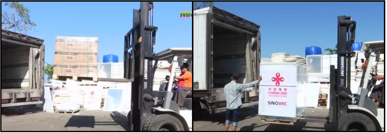
တိုင်းဒေသကြီးနှင့် ပြည်နယ်အသီးသီးသို့ ကိုဗစ်-၁၉ ရောဂါ ကာကွယ်ဆေးများကို သတ်မှတ်အအေးစံချိန်စံညွှန်းများနှင့်အညီ မော်တော်ယာဉ်များဖြင့် ပို့ဆောင်ပေးနေမှု