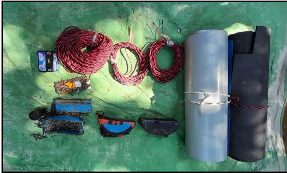
ငပုတောမြို့နယ်၊ လဲလောင်းကျေးရွာအနီး၌ သိမ်းဆည်းရမိသည့် ဖောက်ခွဲရေးပစ္စည်းများ

တရားခံများ၏ ထွက်ဆိုချက်အရ ယခုဖမ်းဆီးရမိ တရားခံများသည် ဖမ်းဆီးရန်ကျန် ပုသိမ် PDF အကြမ်းဖက် အဖွဲ့မှ နန္ဒ၏ စေခိုင်းမှုဖြင့် အစိုးရ၏အုပ်ချုပ်မှုယန္တရား ပျက် ပြားစေရန် ရည်ရွယ်၍ နိုင်ငံဝန်ထမ်းများနှင့် အပြစ်မဲ့ပြည်သူ များအား ဒလန်ဟု စွပ်စွဲကာ လုပ်ကြံသတ်ဖြတ်ခြင်း၊ ပြည်သူ လူထု အထိတ်တလန့်ဖြစ်စေရန် ရည်ရွယ်၍ အများပြည်သူနှင့် သက်ဆိုင်သောနေရာများတွင် အကြမ်းဖက်ဖောက်ခွဲရေးလုပ် ငန်းများ ဆောင်ရွက်ခြင်း၊ လက်နက်/ခဲယမ်းများနှင့် ဖောက်ခွဲ ရေးပစ္စည်းများအား ပို့ဆောင်ခြင်းများ ဆောင်ရွက်ခဲ့ကြောင်း ဖော်ထုတ်သိရှိရပါသည်။