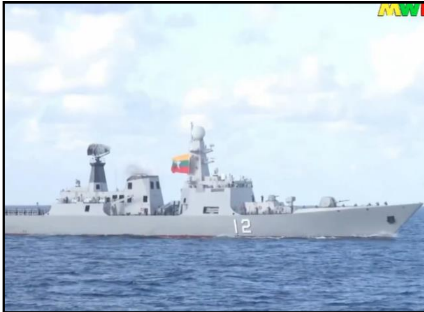
တပ်မတော်(ရေ)မှ စစ်ရေယာဉ်(ကျန်စစ်သား)

စင်ကာပူ၊ ဗီယက်နမ်နှင့် ထိုင်းနိုင်ငံတို့မှ စစ်ရေယာဉ် ၈ စီး၊ ရဟတ်ယာဉ် ၃ စင်းနှင့် ပင်လယ်ရေကြောင်းကင်းထောက်လေယာဉ် ၁ စင်းတို့ ပါဝင်ခဲ့ကြပြီး လာအို၊ ကမ္ဘောဒီးယားနှင့် ဖိလစ်ပိုင်နိုင်ငံတို့မှ လေ့လာသူကိုယ်စားလှယ်များ စေလွှတ်တက်ရောက်ခဲ့ကြသည်။