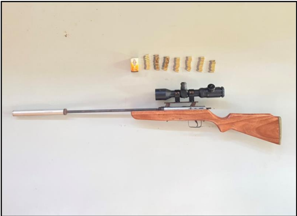
ပုသိမ်မြို့၊ (၁၀)ရပ်ကွက်၊ စက်ကုန်းလမ်းနေ တရားခံ ဖိုးထွေး၏နေအိမ်မှ သိမ်းဆည်းရမိသည့် လက်နက်/ခဲယမ်းများ မှတ်တမ်းဓာတ်ပုံ