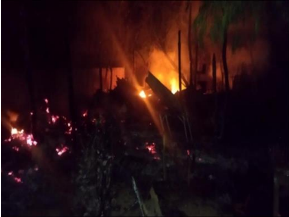
နွားထိုးကြီးမြို့နယ်ရှိ လက်ဝဲမြင်းနီကျေးရွာ၊ ကျေးရွာအုပ်ချုပ်ရေးမှူးနှင့် ၎င်း၏နေအိမ်အား PDF အကြမ်းဖက်အဖွဲ့က ရက်စက်စွာ သတ်ဖြတ်မီးရှို့မှု

မန္တလေးတိုင်းဒေသကြီး၊ နွားထိုးကြီးမြို့နယ်၌ PDF အမည်ခံအကြမ်းဖက်သမားများ၏ ရက်စက်စွာသတ်ဖြတ်မီးရှို့ခဲ့မှုကြောင့် ကျေးရွာအုပ်ချုပ်ရေးမှူးအပါအဝင် အမျိုးသား ၃ ဦးနှင့် အမျိုးသမီး ၁ ဦးတို့ မီးလောင်သေဆုံးကာ အမျိုးသား ၁ ဦးနှင့် အမျိုးသမီး ၁ ဦး ဒဏ်ရာရရှိခဲ့ပါသည်။