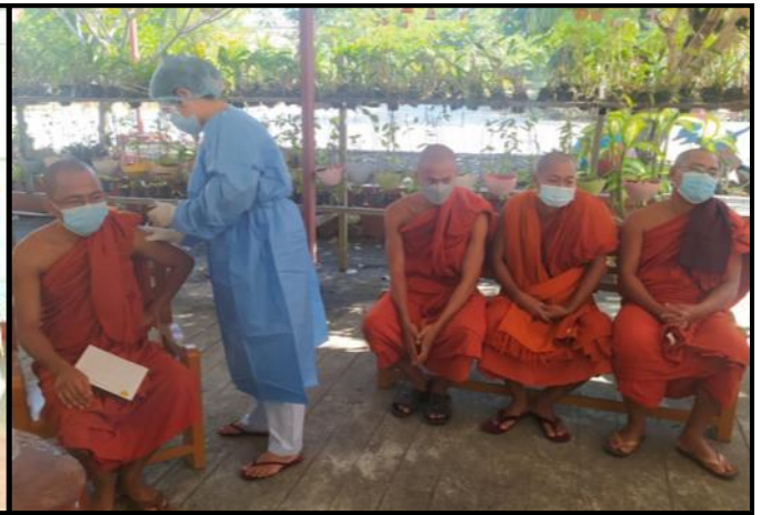
တိုင်းဒေသကြီးနှင့် ပြည်နယ်အသီးသီးတွင် ပြည်သူများအား ကိုဗစ်-၁၉ ရောဂါ ကာကွယ်ဆေးထိုးနှံပေးနေမှု