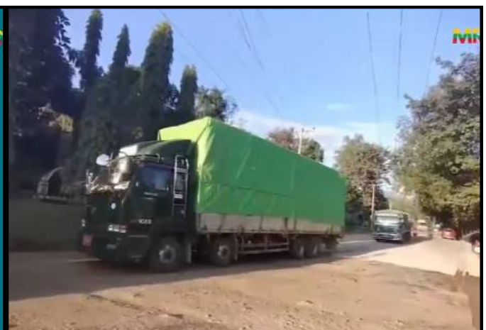
ပြည်ပမှ ကျန်းမာရေးအထောက်အကူပြုပစ္စည်းများ တင်သွင်းနေမှု