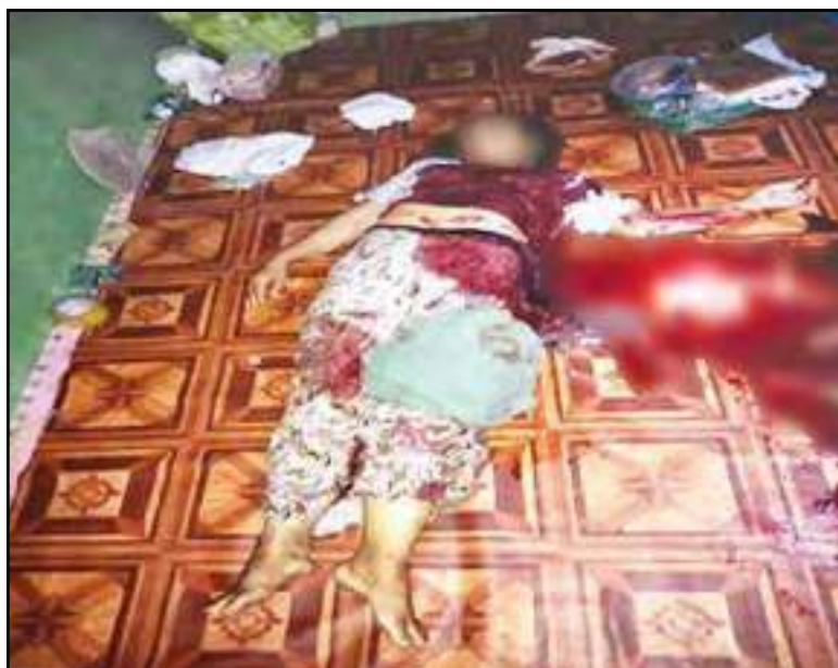
PDF အကြမ်းဖက်သမားများ၏ သေနတ်ဖြင့် ပစ်ခတ်ခံခဲ့ရမှုကြောင့် ကျည်ထိမှန်ဒဏ်ရာဖြင့် သေဆုံးခဲ့သည့် စေတနာ့ဝန်ထမ်းဆရာမ ဒေါ်ဟေမာ