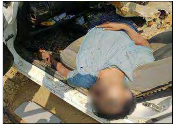
စစ်ကိုင်းတိုင်းဒေသကြီး ကလေးဝမြို့၌ PDF အကြမ်းဖက်အဖွဲ့များထောင်ထားသည့် လက်လုပ်မိုင်းအား နင်းမိပေါက်ကွဲမှုကြောင့် ဒဏ်ရာရရှိကာ သေဆုံးနေသူများ