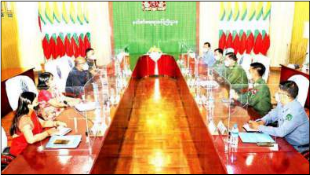
ပြည်ထောင်စုဝန်ကြီး ဒုတိယဗိုလ်ချုပ်ကြီး ထွန်းထွန်းနောင် မြန်မာနိုင်ငံဆိုင်ရာအိန္ဒိယသံအမတ်ကြီးတို့ တွေ့ဆုံဆွေးနွေးနေမှု