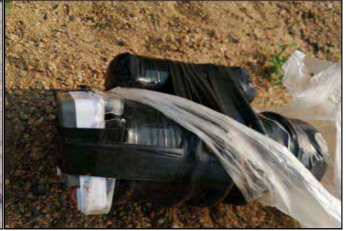
၂၀၂၂ ခုနှစ်၊ မတ်လ ၃၁ ရက်တွင် တပ်ကုန်းမြို့နယ်၊ ရွှေမြို့ကျေးရွာအုပ်စု၊ ထန်းတောကြီးကျေးရွာရှိ အပြစ်မဲ့ပြည်သူ ၁ ဦး၏ နေအိမ်၌ လက်လုပ်ဗုံးတွေ့ရှိမှု