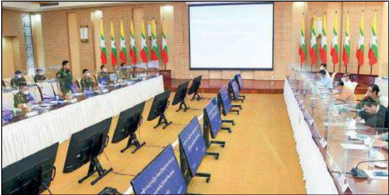
အမျိုးသားစည်းလုံးညီညွတ်ရေးနှင့် ငြိမ်းချမ်းရေးဖော်ဆောင်မှုညှိနှိုင်းရေးကော်မတီနှင့် နိုင်ငံရေးပါတီများအစုအဖွဲ့၏ အလုပ်အဖွဲ့တွေ့ဆုံဆွေးနွေးနေမှု