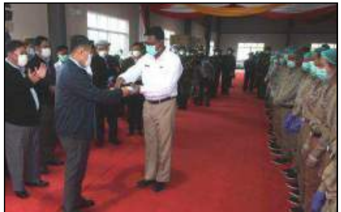
နိုင်ငံတော်စီမံအုပ်ချုပ်ရေးကောင်စီဒုတိယဥက္ကဋ္ဌ ဒုတိယတပ်မတော်ကာကွယ်ရေးဦးစီးချုပ် ဒုတိယဗိုလ်ချုပ်မှူးကြီးစိုးဝင်းက စက်ရုံမှ ဝန်ထမ်းများအတွက် ဂုဏ်ပြုချီးမြှင့်ငွေများပေးအပ်နေမှု