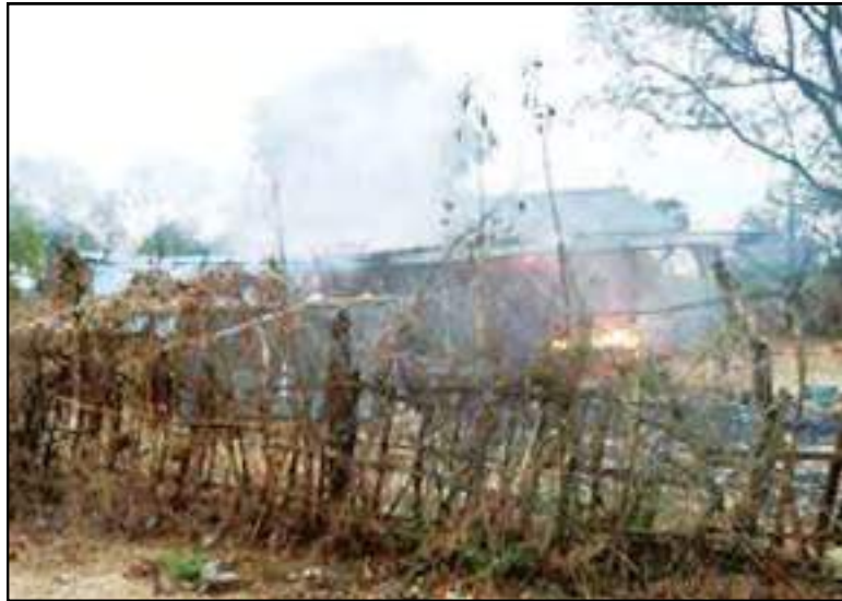
PDF အကြမ်းဖက်သမားများက ကျေးရွာအတွင်းရှိနေအိမ်များအား မီးရှို့ဖျက်ဆီးထားမှု