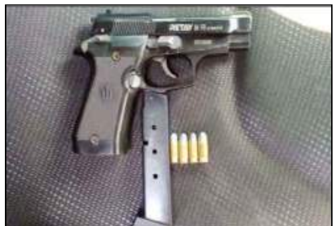
တပ်ကုန်းမြို့နယ်၊ ပင်းစုကျေးရွာရှိ တရားခံထွန်းထွန်းဝင်း၏နေအိမ်၌ သိမ်းဆည်းရမိသည့် လက်နက်/ခဲယမ်း ဖောက်ခွဲရေးပစ္စည်းများ