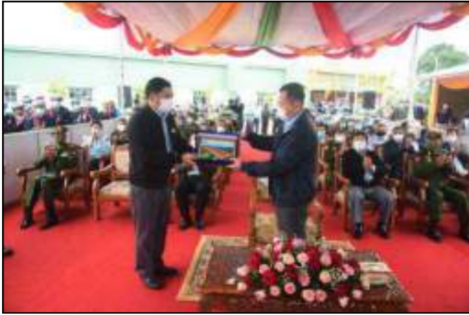
နိုင်ငံတော်စီမံအုပ်ချုပ်ရေးကောင်စီဒုတိယဥက္ကဋ္ဌ ဒုတိယတပ်မတော်ကာကွယ်ရေးဦးစီးချုပ် ဒုတိယဗိုလ်ချုပ်မှူးကြီးစိုးဝင်းထံ စက်ရုံဖွင့်ပွဲ အထိမ်းအမှတ်တံဆိပ်ကို မြန်မာ့စီးပွားရေး ကော်ပိုရေးရှင်းဥက္ကဋ္ဌ ဒုတိယဗိုလ်ချုပ်ကြီးညိုစောက ပေးအပ်နေမှု