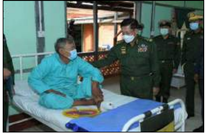
နိုင်ငံတော်စီမံအုပ်ချုပ်ရေးကောင်စီဥက္ကဋ္ဌ တပ်မတော်ကာကွယ်ရေးဦးစီးချုပ် ဗိုလ်ချုပ်မှူးကြီးမင်းအောင်လှိုင်က လားရှိုးမြို့ နယ်မြေခံတပ်မတော်ဆေးရုံ၌ ဆေးကုသမှုခံယူနေသူများအား ကြည့်ရှုစစ်ဆေးနေမှု