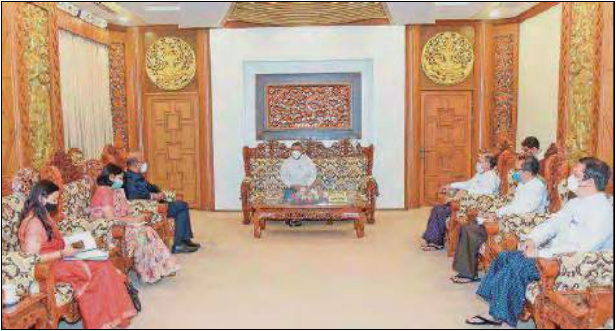
ပြည်ထောင်စုဝန်ကြီး ဦးဝဏ္ဏမောင်လွင်မြန်မာနိုင်ငံဆိုင်ရာအိန္ဒိယသံအမတ်ကြီးတို့ တွေ့ဆုံဆွေးနွေးနေမှု

ကြပ်ကြည့်ရှုရေး ပူးပေါင်းဆောင်ရွက်မည့်ကိစ္စရပ်များ၊ ကျန်းမာရေးလူစွမ်းအား အရင်းအမြစ်ဖွံ့ဖြိုးတိုးတက်ရေး အတွက် အသည်းအစားထိုးခွဲစိတ်ခြင်းများကဲ့သို့သော အဆင့်မြင့်ဆေးပညာပိုင်းဆိုင်ရာသင်တန်းများ သင်ကြား နိုင်ရေးနှင့် ဆေးပညာရပ်ဆိုင်ရာသုတေသနလုပ်ငန်းများ ပိုမိုပူးပေါင်းဆောင်ရွက်ရေးကိစ္စရပ်များ အမြင်ချင်းဖလှယ် ဆွေးနွေးခဲ့။