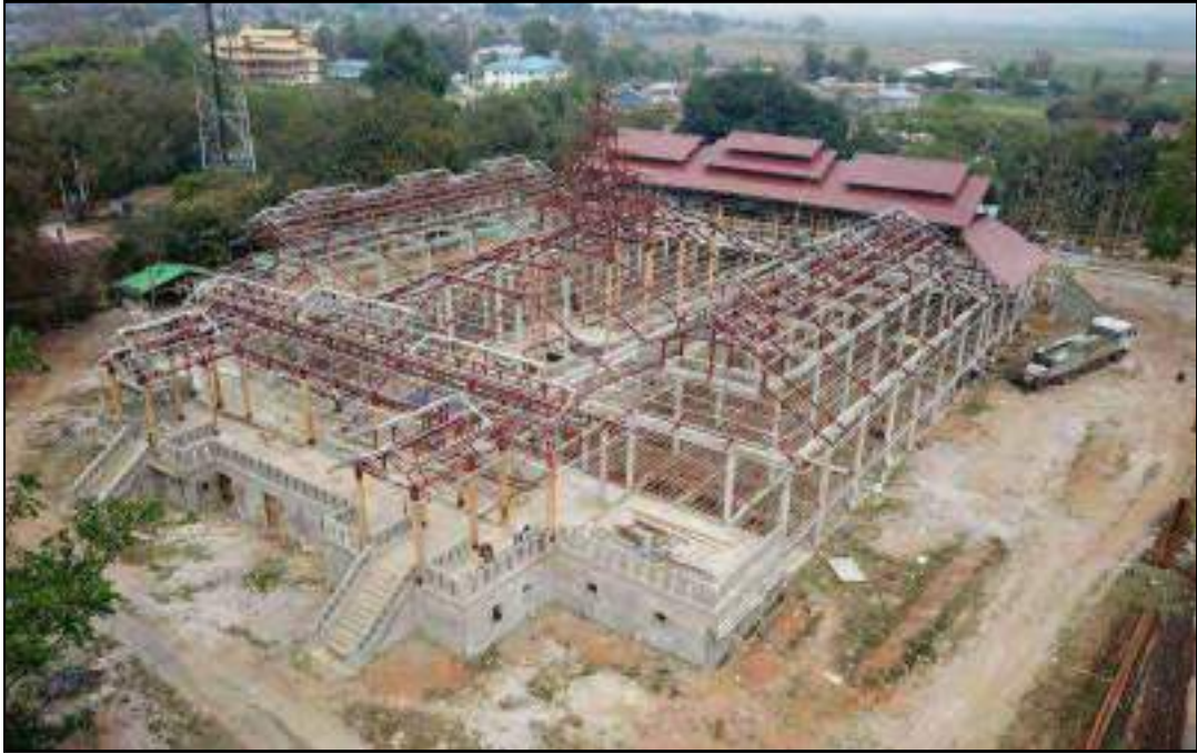
သိန်းနီစော်ဘွားကြီး ခွန်ဆန်တုန်ဟုန်း၏ ကြီးကျယ်ခမ်းနားထည်ဝါသည့် ဟော်နန်းတော်(ဟော်ခမ်းသျှမ်းဝီ)ပြန်လည်တည်ဆောက်နေမှု