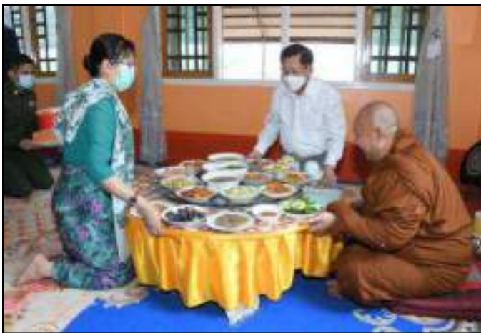
သီရိမင်္ဂလာမန်ဆူရှမ်းကျောင်းတိုက်ဆရာတော် အဂ္ဂမဟာသဒ္ဓမ္မ ဇောတိကဓဇ အဂ္ဂမဟာကမ္မဋ္ဌာနာစရိယ ဒေါက်တာဘဒ္ဒန္တ ပုညနန္ဒအား နိုင်ငံတော်စီမံအုပ်ချုပ်ရေးကောင်စီဥက္ကဋ္ဌ နိုင်ငံတော်ဝန်ကြီးချုပ် ဗိုလ်ချုပ်မှူးကြီးမင်းအောင်လှိုင်နှင့်ဇနီး ဒေါ်ကြူကြူလှတို့က နေ့ဆွမ်းဆက်ကပ်နေမှု