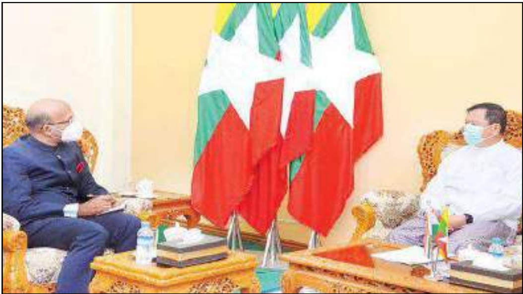
ပြည်ထောင်စုဝန်ကြီး ဦးအောင်သန်းဦး မြန်မာနိုင်ငံဆိုင်ရာအိန္ဒိယသံအမတ်ကြီးတို့ တွေ့ဆုံဆွေးနွေးနေမှု