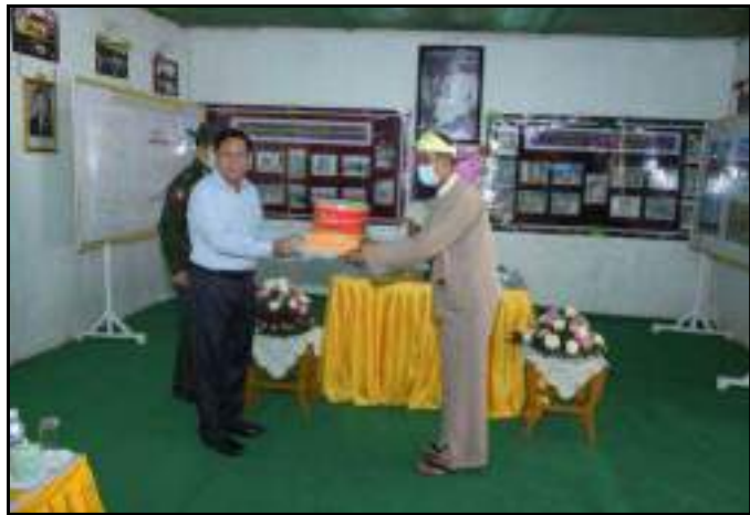
နိုင်ငံတော်စီမံအုပ်ချုပ်ရေးကောင်စီဥက္ကဋ္ဌ နိုင်ငံတော်ဝန်ကြီးချုပ် ဗိုလ်ချုပ်မှူးကြီးမင်းအောင်လှိုင် သိန်းနီမြို့ ဌာနဆိုင်ရာများနှင့် ရပ်မိရပ်ဖများအတွက် စားသောက်ဖွယ်ရာပစ္စည်းများပေးအပ်နေမှု

တိုးတက်စေရေးအတွက် ဆောင်ရွက်သွားမည်ဖြစ်ကြောင်း သိရှိရသည်။