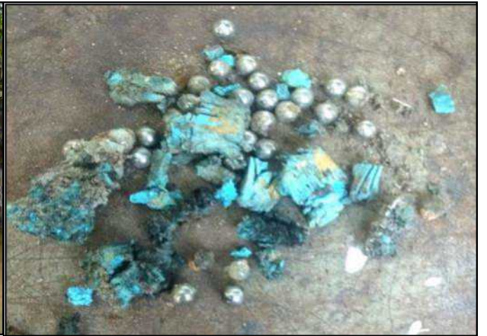
၂၀၂၁ ခုနှစ်၊ နိုဝင်ဘာလ ၁ ရက်တွင် တပ်ကုန်းမြို့၊ ဗိုလ်မင်းရောင်ရပ်ကွက်ရှိ မြို့နယ်လျှပ်စစ်ရုံးအတွင်း၌ လက်လုပ်ဗုံးပေါက်ကွဲမှု