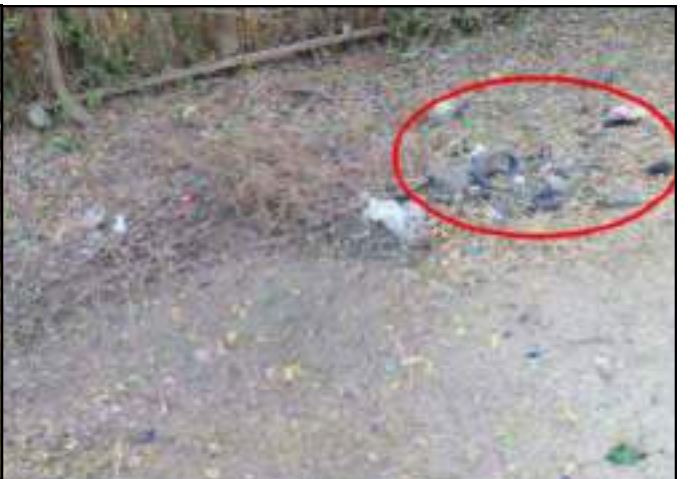
၂၀၂၁ ခုနှစ်၊ ဒီဇင်ဘာလ ၂၁ ရက် တပ်ကုန်းမြို့ရှိ ပြည်ထောင်စုကြံ့ခိုင်ရေးနှင့် ဖွံ့ဖြိုးရေးပါတီရုံးအနီး၌ လက်လုပ်ဗုံးပေါက်ကွဲမှု