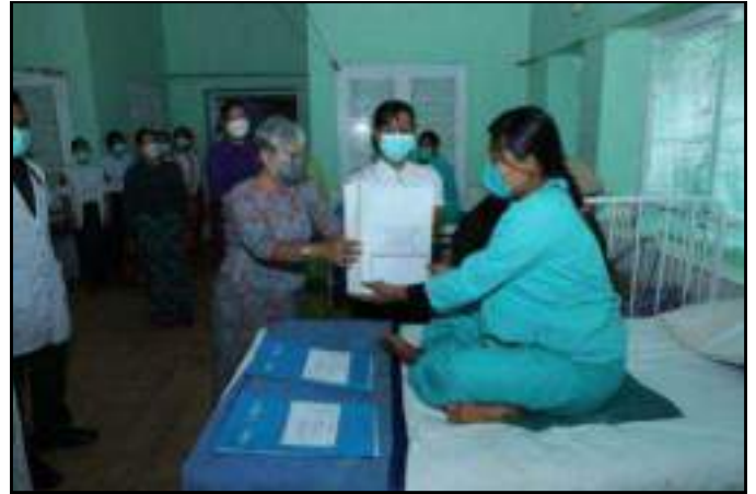
နိုင်ငံတော်စီမံအုပ်ချုပ်ရေးကောင်စီဒုတိယဥက္ကဋ္ဌ ဒုတိယတပ်မတော်ကာကွယ်ရေးဦးစီးချုပ် ကာကွယ်ရေးဦးစီးချုပ်(ကြည်း) ဒုတိယဗိုလ်ချုပ်မှူးကြီးစိုးဝင်းနှင့်ဇနီး ဒေါ်သန်းသန်းနွယ်တို့က ဆေးကုသမှုခံယူနေသူများအား စားသောက်ဖွယ်ရာနှင့် ထောက်ပံ့ပစ္စည်းများပေးအပ်နေမှု