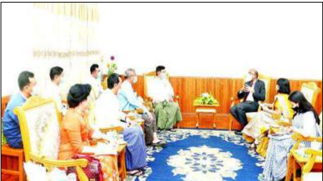
ပြည်ထောင်စုဝန်ကြီး ဒေါက်တာညွန့်ဖေ မြန်မာနိုင်ငံဆိုင်ရာအိန္ဒိယသံအမတ်ကြီးတို့ တွေ့ဆုံဆွေးနွေးနေမှု