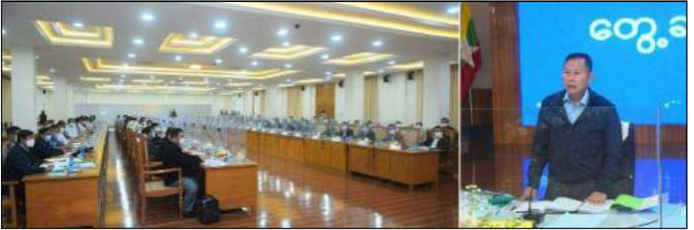
နိုင်ငံတော်စီမံအုပ်ချုပ်ရေးကောင်စီဒုတိယဥက္ကဋ္ဌ ဒုတိယတပ်မတော်ကာကွယ်ရေးဦးစီးချုပ် ကာကွယ်ရေးဦးစီးချုပ်(ကြည်း) ဒုတိယဗိုလ်ချုပ်မှူးကြီးစိုးဝင်း တောင်ကြီးမြို့ရှိ ရှမ်းပြည်နယ်အစိုးရအဖွဲ့ဝင်များနှင့် ပြည်နယ်အဆင့်ဌာနဆိုင်ရာများအား တွေ့ဆုံအမှာစကားပြောကြားနေမှု

၍ အမျိုးသားပြန်လည်စည်းလုံးညီညွတ်ရေးနှင့် ငြိမ်းချမ်းရေးဖော်ဆောင်မှုကော်မတီ အဆင့်ဆင့်ဖွဲ့စည်းကာ ညှိနှိုင်းရေးကော်မတီအနေဖြင့် သက်ဆိုင်ရာပါတီများ၊ NCA လက်မှတ်ရေးထိုးပြီးနှင့် ရေးထိုးရန်ညှိနှိုင်းဆဲ တိုင်းရင်းသားလက်နက်ကိုင်အဖွဲ့အစည်းများနှင့် ဆွေးနွေးမှုများ ကြိုးပမ်းဆောင်ရွက်လျက်ရှိကြောင်း။