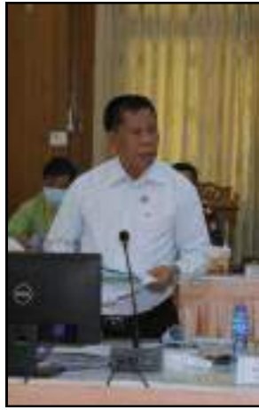
မန္တလေးတိုင်းဒေသကြီးဝန်ကြီးချုပ်ဦးမောင်ကိုက ရှင်းလင်းတင်ပြနေမှု