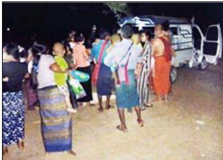
PDF အကြမ်းဖက်သမားများ၏ အန္တရာယ်ကို ကြောက်ရွံ့၍ ဘေးလွတ်ရာသို့ ထွက်ပြေးတိမ်းရှောင်နေကြသည့် ကျေးရွာနေပြည်သူအချို့ကို တွေ့ရစဉ်