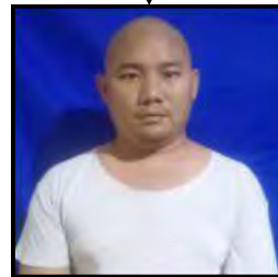
ထက်လွင်(၃၆)နှစ်