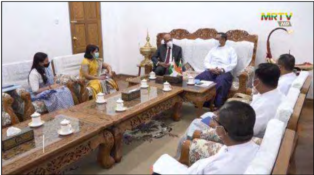
ပြည်ထောင်စုဝန်ကြီး ဦးရွှေလေး မြန်မာနိုင်ငံဆိုင်ရာအိန္ဒိယသံအမတ်ကြီးတို့ တွေ့ဆုံဆွေးနွေးနေမှု