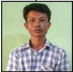
သန်းထွန်းနောင်(၄၀)နှစ်