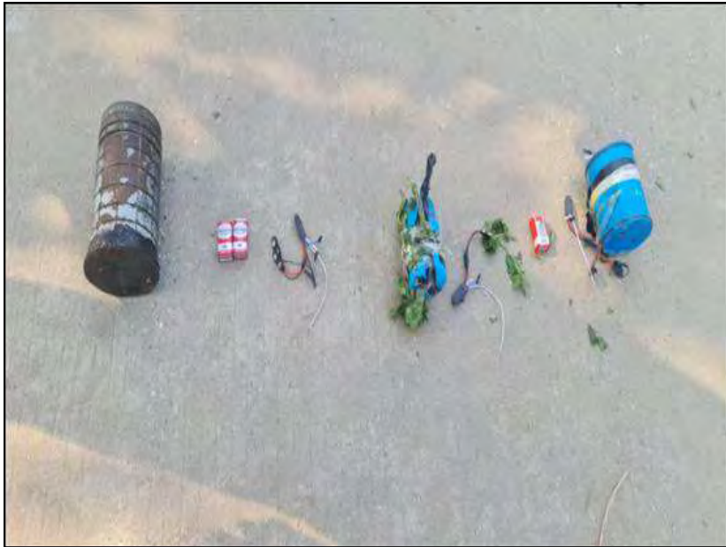
ရန်ကုန်တိုင်းဒေသကြီး၊ ရွှေပြည်သာမြို့နယ်၊ အမှတ်(၃)အခြေခံပညာအထက်တန်းကျောင်းအနီး၌ လက်လုပ်မိုင်း ၃ လုံး တွေ့ရှိမှု