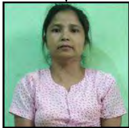
ချစ်စံပယ်(၄၁)နှစ်