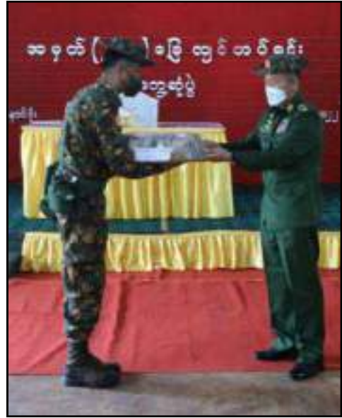
နိုင်ငံတော်စီမံအုပ်ချုပ်ရေးကောင်စီဒုတိယဥက္ကဋ္ဌ ဒုတိယတပ်မတော်ကာကွယ်ရေးဦးစီးချုပ် ကာကွယ်ရေးဦးစီးချုပ်(ကြည်း) ဒုတိယဗိုလ်ချုပ်မှူးကြီးစိုးဝင်းက တောင်ကြီးတပ်နယ်နှင့် နောင်ပိုးတပ်နယ်တို့မှ အရာရှိ၊ စစ်သည်၊ မိသားစုများအတွက် စားသောက်ဖွယ်ရာများနှင့် ထောက်ပံ့ငွေများကို ပေးအပ်နေမှု