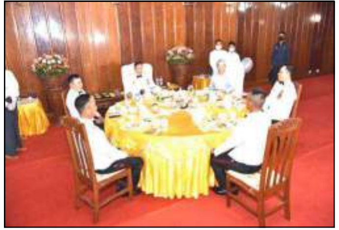
နိုင်ငံတော်စီမံအုပ်ချုပ်ရေးကောင်စီဒုတိယဥက္ကဋ္ဌ ဒုတိယတပ်မတော်ကာကွယ်ရေးဦးစီးချုပ် ကာကွယ်ရေးဦးစီးချုပ်(ကြည်း) ဒုတိယဗိုလ်ချုပ်မှူးကြီးသရေစည်သူစိုးဝင်းက သင်တန်းဆင်းအရာရှိများအား ရင်းရင်းနှီးနှီးလိုက်လံနှုတ်ဆက်ပြီးနောက် ညစာအတူတကွသုံးဆောင်နေမှု