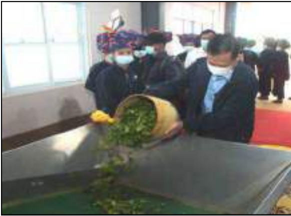
နိုင်ငံတော်စီမံအုပ်ချုပ်ရေးကောင်စီဒုတိယဥက္ကဋ္ဌ ဒုတိယတပ်မတော်ကာကွယ်ရေးဦးစီးချုပ် ဒုတိယဗိုလ်ချုပ်မှူးကြီးစိုးဝင်း လက်ဖက်ရွက်စိမ်းများအား ဘတ်ကွန်ပေယာလေးအတွင်းသို့ ထည့်သွင်းနေမှု