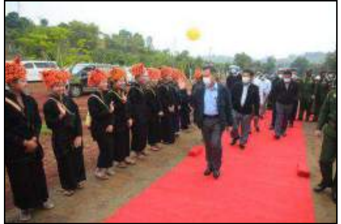
နိုင်ငံတော်စီမံအုပ်ချုပ်ရေးကောင်စီဒုတိယဥက္ကဋ္ဌ ဒုတိယတပ်မတော်ကာကွယ်ရေးဦးစီးချုပ် ဒုတိယဗိုလ်ချုပ်မှူးကြီးစိုးဝင်းအား ဒေသခံတိုင်းရင်းသား ပြည်သူများက လှိုက်လှဲစွာကြိုဆိုနှုတ်ဆက်နေမှု