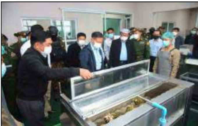
နိုင်ငံတော်စီမံအုပ်ချုပ်ရေးကောင်စီဒုတိယဥက္ကဋ္ဌ ဒုတိယတပ်မတော်ကာကွယ်ရေးဦးစီးချုပ် ဒုတိယဗိုလ်ချုပ်မှူးကြီးစိုးဝင်း သစ်သီးအခြောက်ခံမှုလုပ်ငန်းအဆင့်ဆင့်ကို ကြည့်ရှုနေမှု