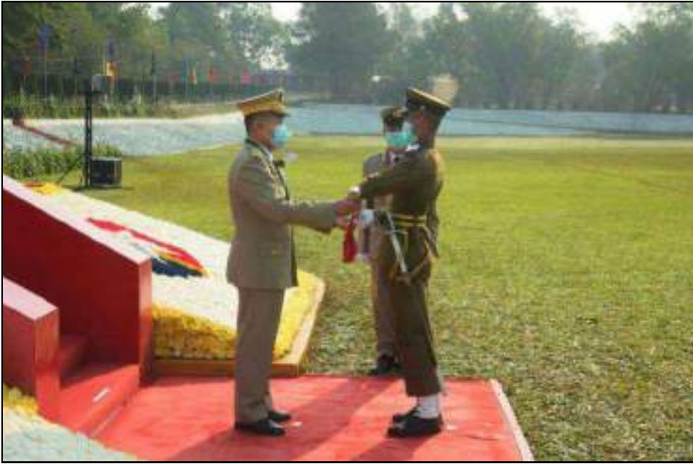
နိုင်ငံတော်စီမံအုပ်ချုပ်ရေးကောင်စီဒုတိယဥက္ကဋ္ဌ ဒုတိယတပ်မတော်ကာကွယ်ရေးဦးစီးချုပ် ကာကွယ်ရေးဦးစီးချုပ်(ကြည်း) ဒုတိယဗိုလ်ချုပ်မှူးကြီးသရေစည်သူစိုးဝင်းက အကောင်းဆုံးဗိုလ်လောင်းဆုရရှိသူ ဗိုလ်လောင်းအောင်မင်းသူအား ငွေစားဆုချီးမြှင့်ပေးအပ်နေမှု

တာဝန်ယူဖြေရှင်းနိုင်သည့် ခေါင်းဆောင်များဖြစ်ရန် လိုအပ်ကြောင်း။