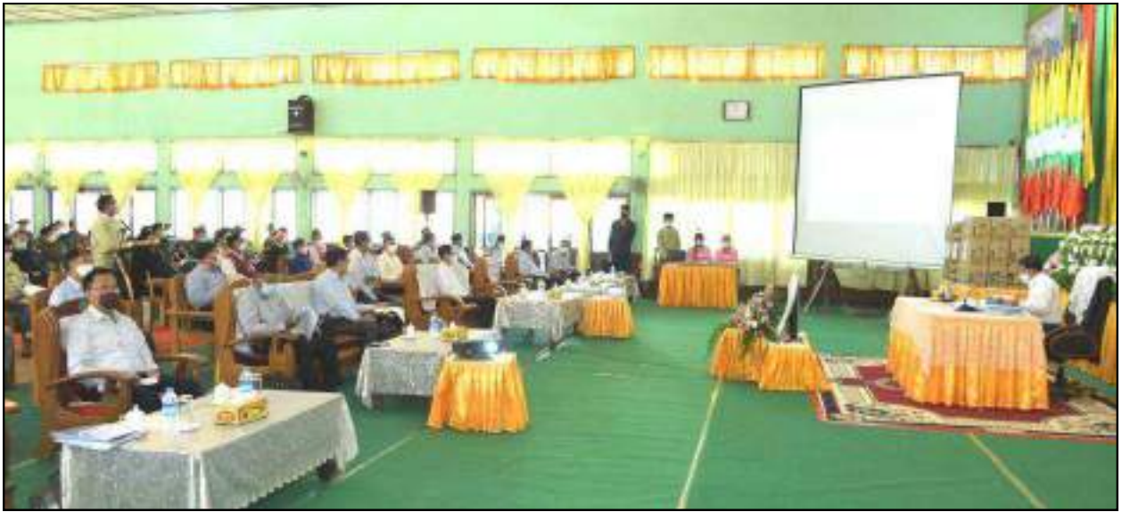
နိုင်ငံတော်စီမံအုပ်ချုပ်ရေးကောင်စီဥက္ကဋ္ဌ နိုင်ငံတော်ဝန်ကြီးချုပ် ဗိုလ်ချုပ်မှူးကြီးမင်းအောင်လှိုင်အား ရှမ်းပြည်နယ်(မြောက်ပိုင်း) အစိုးရအုပ်ချုပ်ရေးအဖွဲ့ခွဲဥက္ကဋ္ဌနှင့် လားရှိုးခရိုင်စီမံအုပ်ချုပ်ရေးအဖွဲ့ဥက္ကဋ္ဌတို့က ဒေသဖွံ့ဖြိုးတိုးတက်ရေးဆိုင်ရာ ကိစ္စရပ်များနှင့်ပတ်သက်၍ ရှင်းလင်းတင်ပြစဉ်