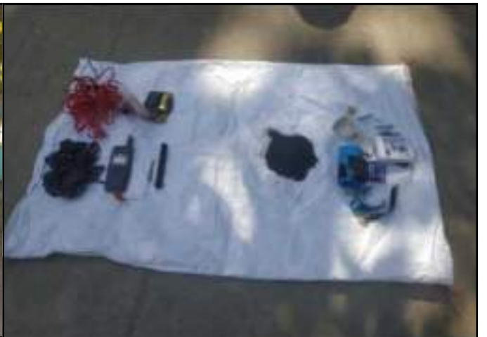
၂၀၂၁ ခုနှစ်၊ ဒီဇင်ဘာလ ၂၇ ရက်တွင် တပ်ကုန်းမြို့၊ အောင်ဇေယျာရပ်ကွက်ရှိ ထရန်စဖော်မာ၌ လက်လုပ်ဗုံးတွေ့ရှိမှု