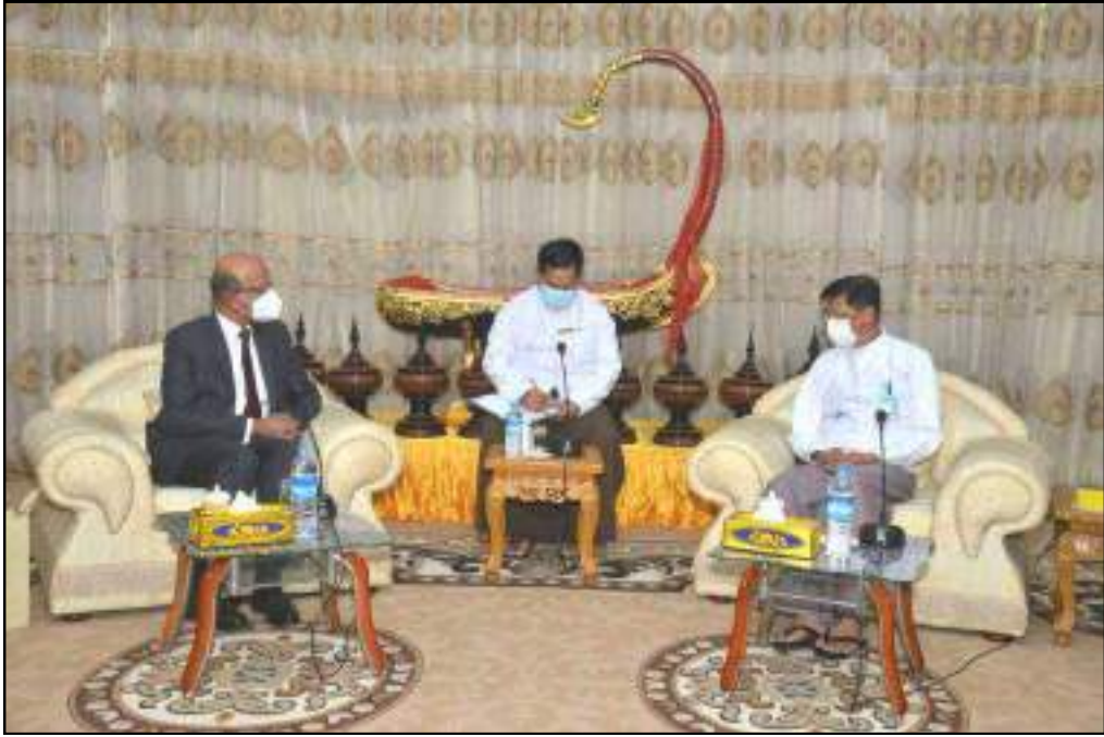
ပြည်ထောင်စုဝန်ကြီး ဗိုလ်ချုပ်ကြီးမြထွန်းဦး၊ မြန်မာနိုင်ငံဆိုင်ရာ အိန္ဒိယနိုင်ငံ သံအမတ်ကြီးတို့ တွေ့ဆုံဆွေးနွေးနေမှု

မြန်မာနိုင်ငံဆိုင်ရာအိန္ဒိယသံအမတ်ကြီး H.E. Mr. Vinay Kumar အား ကာကွယ်ရေးဝန်ကြီးဌာန၊ ပြည်ထဲရေးဝန်ကြီးဌာန၊ နိုင်ငံခြားရေးဝန်ကြီးဌာန၊ နယ်စပ်ရေးရာဝန်ကြီးဌာန၊ စီမံကိန်းနှင့် ဘဏ္ဍာရေးဝန်ကြီးဌာန၊ အပြည်ပြည်ဆိုင်ရာပူးပေါင်းဆောင်ရွက်ရေးဝန်ကြီးဌာန၊ ပို့ဆောင်ရေးနှင့် ဆက်သွယ်ရေးဝန်ကြီးဌာန၊ လျှပ်စစ်နှင့်စွမ်းအင်ဝန်ကြီးဌာန၊ ပညာရေးဝန်ကြီးဌာန၊ ကျန်းမာရေးဝန်ကြီးဌာနနှင့် ဆောက်လုပ်ရေးဝန်ကြီးဌာနတို့မှ ပြည်ထောင်စုဝန်ကြီးများက သီးခြားစီလက်ခံတွေ့ဆုံဆွေးနွေးမှုများပြုလုပ်ခဲ့ပါသည်-