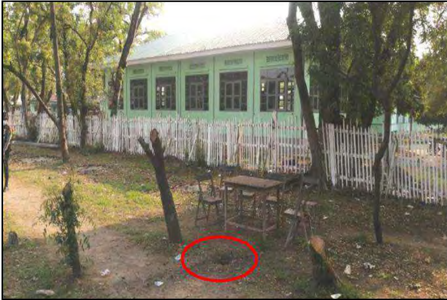
၂၀၂၂ ခုနှစ်၊ ဧပြီလ ၄ ရက်တွင် တပ်ကုန်းမြို့နယ်၊ ညောင်လွန်ကျေးရွာရှိ အထက(ညောင်လွန်)ကျောင်းဝင်း ခြံစည်းရိုးအပြင်ဘက်၌ လက်လုပ်ဗုံးပေါက်ကွဲမှု

ဖြစ်စေရန်ရည်ရွယ်၍ အများပြည်သူနှင့် သက်ဆိုင်သောနေရာများတွင် အကြမ်းဖက်ဖောက်ခွဲမှုများကျူးလွန်ခဲ့ရာ-