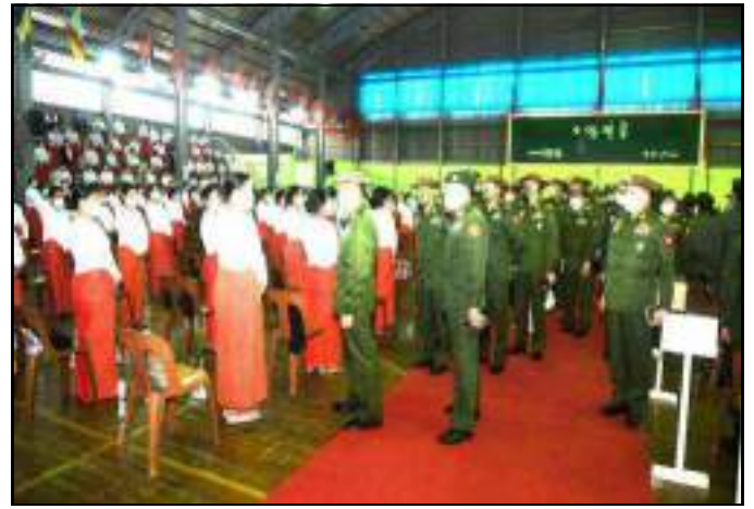
နိုင်ငံတော်စီမံအုပ်ချုပ်ရေးကောင်စီဒုတိယဥက္ကဋ္ဌ ဒုတိယတပ်မတော်ကာကွယ်ရေးဦးစီးချုပ် ကာကွယ်ရေးဦးစီးချုပ်(ကြည်း) ဒုတိယဗိုလ်ချုပ်မှူးကြီးစိုးဝင်း တောင်ကြီးတပ်နယ်မှ အရာရှိ၊ စစ်သည်များအားရင်းရင်းနှီးနှီးနှုတ်ဆက်နေမှု