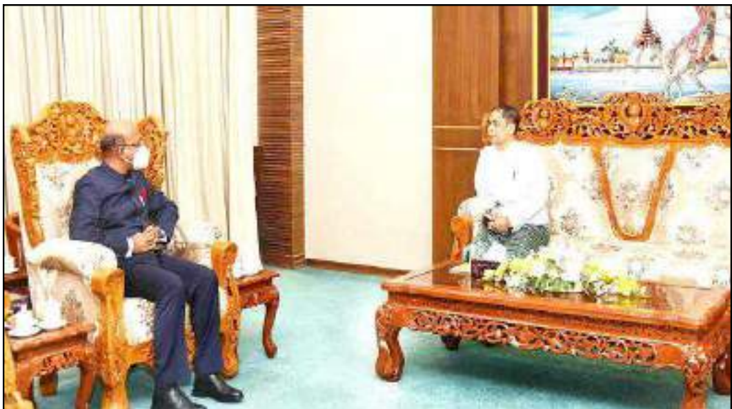
ပြည်ထောင်စုဝန်ကြီး ဦးကိုကိုလှိုင် မြန်မာနိုင်ငံဆိုင်ရာအိန္ဒိယသံအမတ်ကြီးတို့ တွေ့ဆုံဆွေးနွေးနေမှု