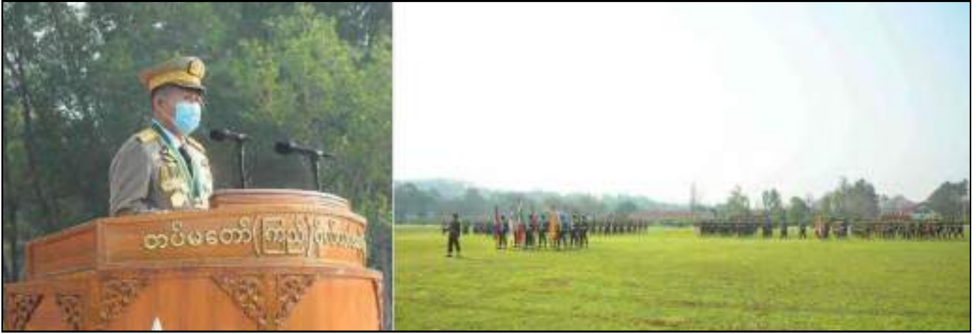
နိုင်ငံတော်စီမံအုပ်ချုပ်ရေးကောင်စီဥက္ကဋ္ဌ တပ်မတော်ကာကွယ်ရေးဦးစီးချုပ် ဗိုလ်ချုပ်မှူးကြီး မဟာသရေစည်သူမင်းအောင်လှိုင်ကိုယ်စား နိုင်ငံတော်စီမံအုပ်ချုပ်ရေးကောင်စီဒုတိယဥက္ကဋ္ဌ ဒုတိယတပ်မတော်ကာကွယ်ရေးဦးစီးချုပ် ကာကွယ်ရေးဦးစီးချုပ်(ကြည်း) ဒုတိယဗိုလ်ချုပ်မှူးကြီးသရေစည်သူစိုးဝင်း တပ်မတော်(ကြည်း) ဗိုလ်သင်တန်းကျောင်း(ဗထူး)ဗိုလ်လောင်းသင်တန်းအမှတ်စဉ်(၁၂၅) သီဟတပ်ခွဲသင်တန်းဆင်းဂုဏ်ပြုစစ်ရေးပြအခမ်းအနားတွင် မိန့်ခွန်းပြောကြားနေမှု

အတွက် တပ်မတော်တစ်ရပ် မရှိမဖြစ်လိုအပ်ပြီး တပ်မတော်သားတိုင်းသည်လည်း မျိုးချစ်စိတ်ဓာတ်ရှင်သန်ထက်မြက်နေရန်လိုအပ်ကြောင်း။ • ပစ္စုပ္ပန်ကာလတွင်လည်း တပ်မတော်အနေဖြင့် ပြည်သူတို့၏ဆန္ဒဖြစ်သော ပါတီစုံဒီမိုကရေစီလမ်းကြောင်း တည်တံ့ခိုင်မြဲစေရေးနှင့် နိုင်ငံ၏အဓိကလိုအပ်ချက်ဖြစ်သော တည်ငြိမ်အေးချမ်းရေးနှင့် ထာဝရငြိမ်းချမ်းရေးတို့အတွက် စိန်ခေါ်မှုမျိုးစုံကို ရင်ဆိုင်ပြီး နိုင်ငံတော်နှင့်နိုင်ငံသားတို့၏ အကျိုးစီးပွားကိုရှေးရှုကာ နိုင်ငံတော်ကာကွယ်ရေးတာဝန်ကို ဦးလည်မသုန်ကျေပွန်အောင် ထမ်းဆောင်လျက်ရှိကြောင်း။ • တပ်မတော်ကို ခေတ်မီတပ်မတော်အဖြစ် တည်ဆောက်ရာတွင် တိုက်ပွဲစွမ်းရည်နှင့် တိုက်ပွဲစွမ်းအားများ ပြည့်စုံနေရန်လိုအပ်ပြီး တိုက်ပွဲစွမ်းရည် ပြည့်ဝစေရန် စွမ်းရည်ထက်မြက်ပြီး အရည်အချင်းပြည့်ဝသောစစ်သည်များ လိုအပ်သည့်အတွက် လူ့စွမ်းအားအရင်းအမြစ်ဖွံ့ဖြိုးတိုးတက်ရေးကို အလေးအနက်ထားဆောင်ရွက်ပေးလျက်ရှိကြောင်း။ • တိုက်ပွဲစွမ်းအားများ ပြည့်ဝစေရေးအတွက်လည်း တပ်မတော်အနေဖြင့် ခေတ်နှင့်လျော်ညီသည့် စစ်လက်နက်ပစ္စည်းများကို တပ်ဆင်အသုံးပြုနိုင်ရေး အစဉ်တစိုက်ကြိုးပမ်းဆောင်ရွက်လျက်ရှိပြီး ဒေသတွင်းနှင့် နိုင်ငံတကာ တပ်မတော်များနည်းတူ ရင်ပေါင်တန်းနိုင်သည့် ခေတ်မီတပ်မတော် (Standard Army)ဖြစ်အောင် အရှိန်အဟုန်ဖြင့် အပိုင်းလိုက်၊ အကန့်အလိုက် အစီအမံများအတိုင်း ဆောင်ရွက်လျက်ရှိကြောင်း။