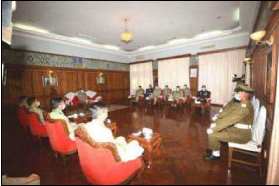
နိုင်ငံတော်စီမံအုပ်ချုပ်ရေးကောင်စီဒုတိယဥက္ကဋ္ဌ ဒုတိယတပ်မတော်ကာကွယ်ရေးဦးစီးချုပ် ကာကွယ်ရေးဦးစီးချုပ်(ကြည်း) ဒုတိယဗိုလ်ချုပ်မှူးကြီးသရေစည်သူစိုးဝင်းက ထူးချွန်ဆုရဖိုလ်လောင်းများအား တွေ့ဆုံ၍ ဂုဏ်ပြုအမှာစကားပြောကြားနေမှု