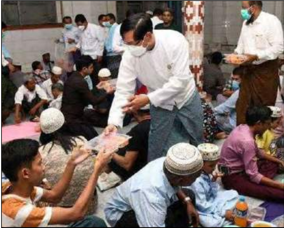
ရန်ကုန်တိုင်းဒေသကြီးဝန်ကြီးချုပ်နှင့် တာဝန်ရှိသူများက မင်္ဂလာတောင်ညွန့်မြို့နယ် တခြမ်းပဲ့ဗလီနှင့် ပန်းပဲတန်းမြို့နယ် ကျိုလီယာဂျာမေဗလီတို့၌ ရာမဒန်လမြတ်ကာလတွင် ဥပုသ်ဝင်ရောက်ကြသူများအတွက် စားသောက်ဖွယ်ရာများနှင့် အလှူငွေများပေးအပ်လှူဒါန်းနေမှု

ရန်ကုန်တိုင်းဒေသကြီးနှင့် မန္တလေးတိုင်းဒေသကြီး အတွင်းရှိ အစ္စလာမ်ဘာသာဝင်များ၏ ရာမဒန်လမြတ်ကာလ တွင် ဥပုသ်ဝင်ရောက်ကြသူများအတွက် စားသောက်ဖွယ်ရာ များကို သက်ဆိုင်ရာတိုင်းဒေသကြီးဝန်ကြီးချုပ်များ၊ တိုင်းစစ် ဌာနချုပ်အသီးသီးမှ တိုင်းမှူးနှင့် တာဝန်ရှိသူများက သွားရောက် ပေးအပ်လှူဒါန်းလျက်ရှိရာ-