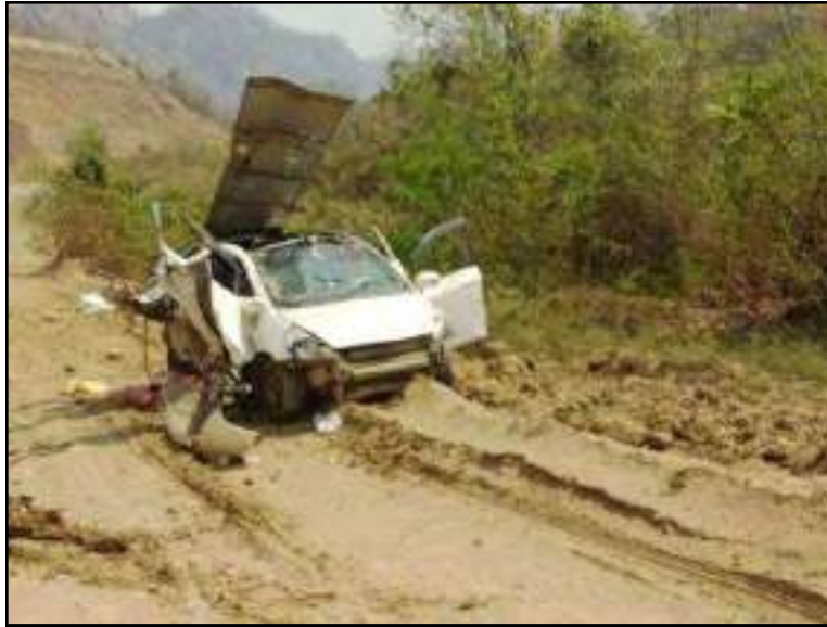
စစ်ကိုင်းတိုင်းဒေသကြီး ကလေးဝမြို့၌ PDF အကြမ်းဖက်အဖွဲ့များထောင်ထားသည့် လက်လုပ်မိုင်းအား နင်းမိပေါက်ကွဲမှုကြောင့် မော်တော်ယာဉ်ပျက်စီးမှု