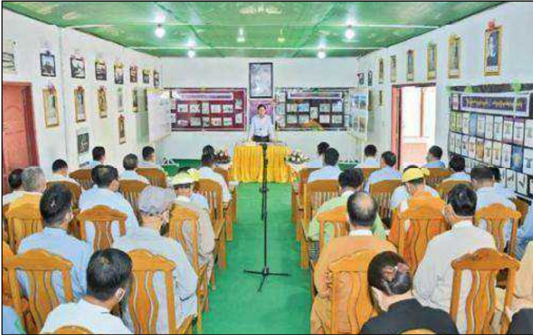
နိုင်ငံတော်စီမံအုပ်ချုပ်ရေးကောင်စီဥက္ကဋ္ဌ နိုင်ငံတော်ဝန်ကြီးချုပ် ဗိုလ်ချုပ်မှူးကြီးမင်းအောင်လှိုင် သိန်းနီမြို့တွင် တာဝန်ထမ်းဆောင်လျက်ရှိသည့် ဌာနဆိုင်ရာဝန်ထမ်းများ၊ မြို့မိမြို့ဖများအား တွေ့ဆုံအမှာစကားပြောကြားနေမှု

ဟော်နန်းကြီးကို ပြန်လည်တည်ဆောက်ပေးနိုင်ရေး စဉ်းစားဆောင်ရွက်ခဲ့ခြင်းဖြစ်ကြောင်း။