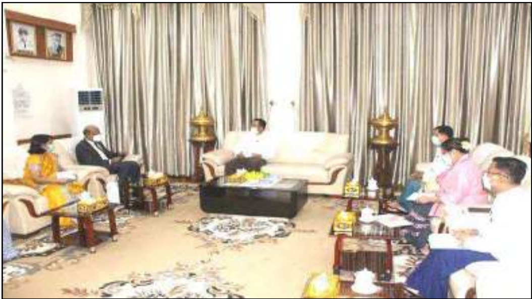
ပြည်ထောင်စုဝန်ကြီး ဦးဝင်းရှိန် မြန်မာနိုင်ငံဆိုင်ရာ အိန္ဒိယနိုင်ငံသံအမတ်ကြီးတို့ တွေ့ဆုံဆွေးနွေးနေမှု