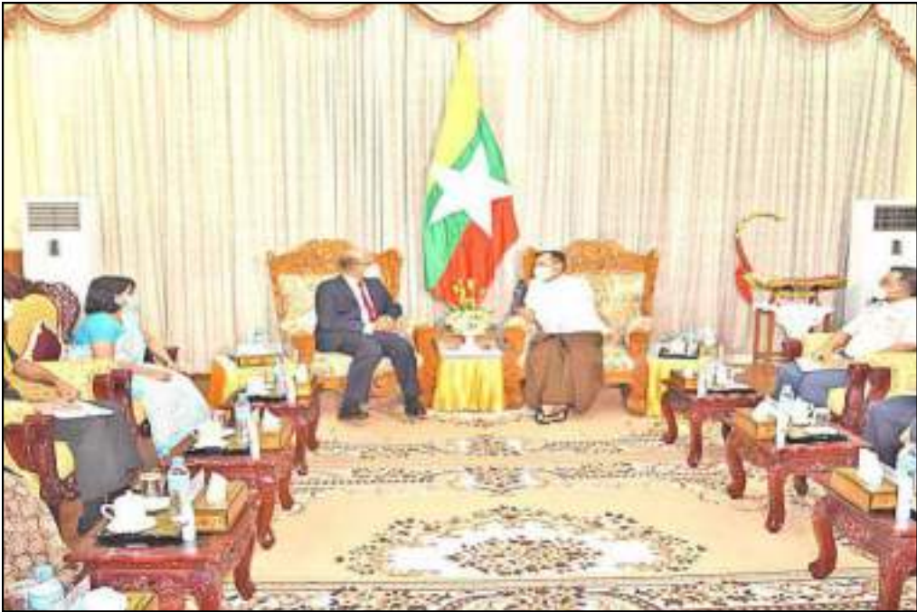
ပြည်ထောင်စုဝန်ကြီး ဒုတိယဗိုလ်ချုပ်ကြီးစိုးထွဋ် မြန်မာနိုင်ငံဆိုင်ရာ အိန္ဒိယနိုင်ငံ သံအမတ်ကြီးတို့ တွေ့ဆုံဆွေးနွေးနေမှု