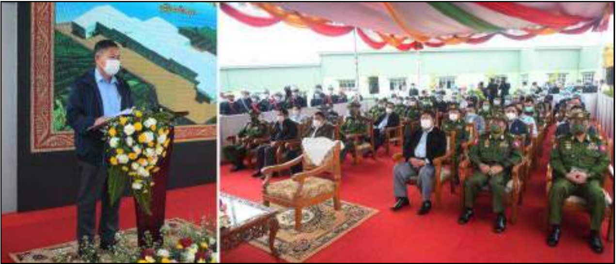
နိုင်ငံတော်စီမံအုပ်ချုပ်ရေးကောင်စီဒုတိယဥက္ကဋ္ဌ ဒုတိယတပ်မတော်ကာကွယ်ရေးဦးစီးချုပ် ကာကွယ်ရေးဦးစီးချုပ်(ကြည်း) ဒုတိယဗိုလ်ချုပ်မှူးကြီးစိုးဝင်း လက်ဖက်အချိုခြောက်နှင့် သစ်သီးအခြောက်ခံ စက်ရုံ(နောင်တရား)ဖွင့်ပွဲအမှာစကား ပြောကြားနေမှု