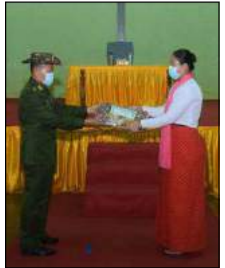
နိုင်ငံတော်စီမံအုပ်ချုပ်ရေးကောင်စီဒုတိယဥက္ကဋ္ဌ ဒုတိယတပ်မတော်ကာကွယ်ရေးဦးစီးချုပ် ကာကွယ်ရေးဦးစီးချုပ်(ကြည်း) ဒုတိယဗိုလ်ချုပ်မှူးကြီးစိုးဝင်းက ကျိုင်းခမ်းတပ်နယ်၊ မိုင်းပျဉ်းတပ်နယ်နှင့် တောင်ကြီးတပ်နယ်တို့မှ အရာရှိ၊ စစ်သည်၊ မိသားစုများအတွက် စားသောက်ဖွယ်ရာများနှင့် ထောက်ပံ့ငွေများကို ပေးအပ်နေမှု