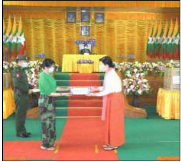
နိုင်ငံတော်စီမံအုပ်ချုပ်ရေးကောင်စီဥက္ကဋ္ဌ တပ်မတော်ကာကွယ်ရေးဦးစီးချုပ် ဗိုလ်ချုပ်မှူးကြီးမင်းအောင်လှိုင်နှင့်ဇနီး ဒေါ်ကြူကြူလှတို့က လားရှိုးတပ်နယ်မှ အရာရှိ၊ စစ်သည်၊ မိသားစုဝင်များနှင့် တပ်နယ်မိခင်နှင့်ကလေးစောင့်ရှောက်ရေးအသင်းတို့အတွက် စားသောက်ဖွယ်ရာပစ္စည်းများနှင့် ချီးမြှင့်ငွေများပေးအပ်နေမှု

ပြည်သူလူထုထံသို့ ချပြပြီးမှ ပြည်လုံးကျွတ်ဆန္ဒခံယူပွဲ လုပ်ကာအတည်ပြုခဲ့ခြင်းဖြစ်ပြီး ဆိုရှယ်လစ်နိုင်ငံကို တရားဝင်တည်ထောင်ခဲ့ခြင်းဖြစ်ကြောင်း။