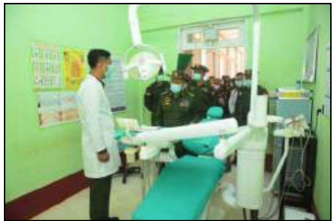
နိုင်ငံတော်စီမံအုပ်ချုပ်ရေးကောင်စီဒုတိယဥက္ကဋ္ဌ ဒုတိယတပ်မတော်ကာကွယ်ရေးဦးစီးချုပ် ကာကွယ်ရေးဦးစီးချုပ်(ကြည်း) ဒုတိယဗိုလ်ချုပ်မှူးကြီးစိုးဝင်းက ဆေးရုံအတွင်း လိုက်လံကြည့်ရှုစစ်ဆေးနေမှု