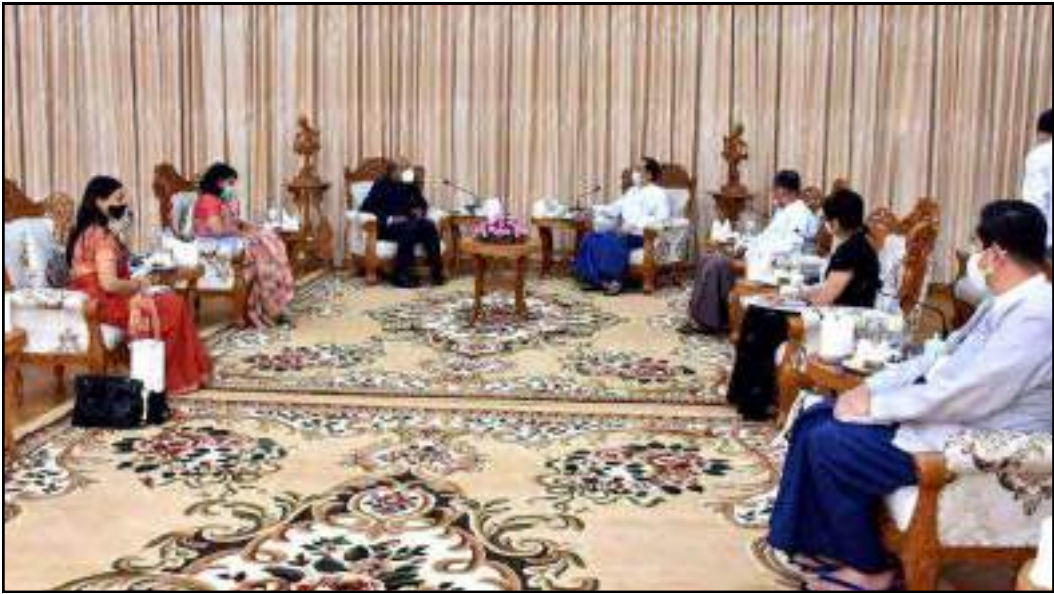
ပြည်ထောင်စုဝန်ကြီး ဒေါက်တာသက်ခိုင်ဝင်း မြန်မာနိုင်ငံဆိုင်ရာအိန္ဒိယနိုင်ငံသံအမတ်ကြီးတို့ တွေ့ဆုံဆွေးနွေးနေမှု