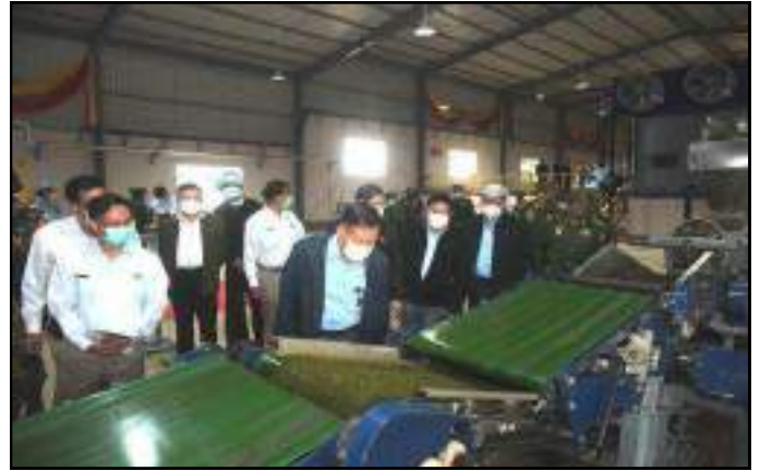
နိုင်ငံတော်စီမံအုပ်ချုပ်ရေးကောင်စီဒုတိယဥက္ကဋ္ဌ ဒုတိယတပ်မတော်ကာကွယ်ရေးဦးစီးချုပ် ဒုတိယဗိုလ်ချုပ်မှူးကြီးစိုးဝင်း လက်ဖက်အချိုခြောက်ထုတ်လုပ်နေမှုအဆင့်ဆင့်ကို ကြည့်ရှုနေမှု