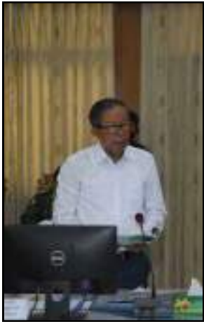
စိုက်ပျိုးရေး၊ မွေးမြူရေးနှင့် နှင့်ဆည်မြောင်းဝန်ကြီးဌာန ပြည်ထောင်စုဝန်ကြီး ဦးတင်ထွဋ်ဦးက ရှင်းလင်းတင်ပြနေမှု