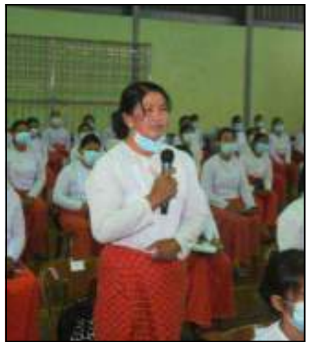
နိုင်ငံတော်စီမံအုပ်ချုပ်ရေးကောင်စီဒုတိယဥက္ကဋ္ဌ ဒုတိယတပ်မတော်ကာကွယ်ရေးဦးစီးချုပ် ကာကွယ်ရေးဦးစီးချုပ်(ကြည်း) ဒုတိယဗိုလ်ချုပ်မှူးကြီးစိုးဝင်းအား တောင်ကြီးတပ်နယ်မှ စစ်သည်၊ ရဲမေများက တင်ပြနေမှု