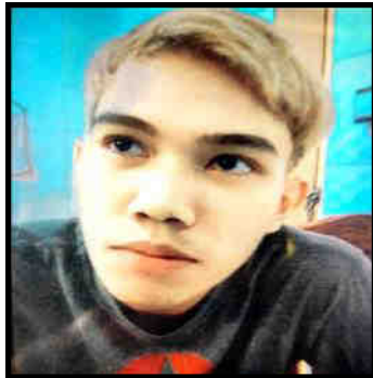
တင့်ထူးနိုင်(၁)ဂူးဂူး(၁၈)နှစ်