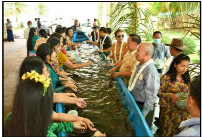
တိုင်းရင်းသားလူမျိုးများရေးရာဝန်ကြီးဌာန မိသားစု အတာရေသဘင်ပွဲ ဆင်နွှဲနေမှု