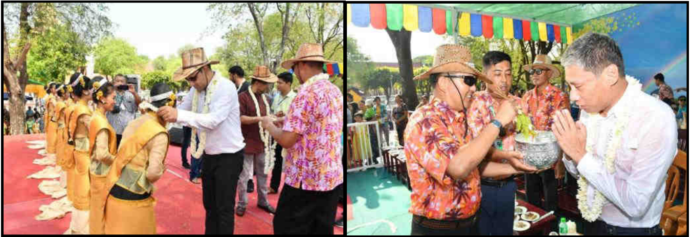
အလယ်ပိုင်းတိုင်းစစ်ဌာနချုပ်ရှိ နန်းမြို့သူရေကစားမဏ္ဍပ်သို့ အိန္ဒိယကောင်စစ်ဝန်နှင့် မိသားစုများ၊ တရုတ်ကောင်စစ်ဝန်နှင့် မိသားစုများ လာရောက်ကြည့်ရှုအားပေးနေမှု

ဧပြီ လ ၁၅ ရက်(သင်္ကြန်အကြတ်နေ့)တွင် ရန်ကုန် မြို့တော်မဟာသင်္ကြန်ရေကစားမဏ္ဍပ်၌ မြန်မာနိုင်ငံဆိုင်ရာ ကိုရီးယားဒီမိုကရက်တစ်ပြည်သူ့သမ္မတနိုင်ငံ သံအမတ်ကြီး ဦးဆောင်သော ရန်ကုန်မြို့ရှိ နိုင်ငံခြားသံရုံးများမှ သံရုံးမိသားစုဝင်များနှင့် သံတမန်မိသားစုများသည် နိုင်ငံခြားရေးဝန်ကြီးဌာနမှ တာဝန်ရှိသူများ၊ ပြည်သူများနှင့်အတူ အတာရေများ ပက်ဖျန်းခြင်း၊ နိုင်ငံကျော်အနုပညာရှင်များနှင့်အတူ တေးသီချင်းများသီဆိုကခုန်ခြင်းနှင့် မဟာဗန္ဓုလပန်းခြံနံဘေးရှိ လမ်းလျှောက်သင်္ကြန်သို့ တက်ရောက်ချီးမြှင့်အားပေးခြင်းများ ပြုလုပ်ခဲ့ကြပါသည်။