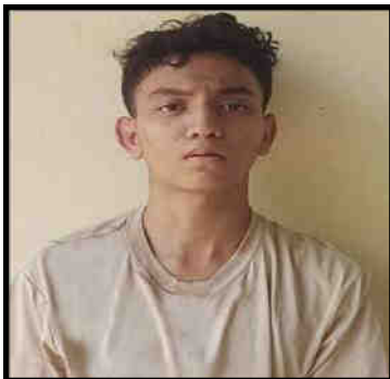
ဟိန်းထက်နိုင်(၁၇)နှစ်