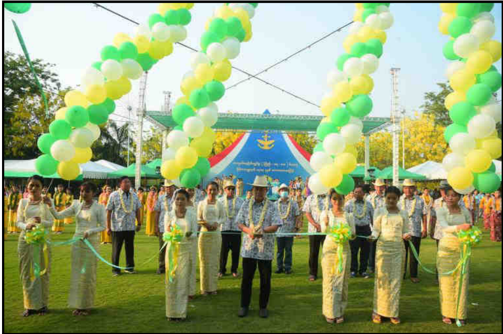
နိုင်ငံတော်စီမံအုပ်ချုပ်ရေးကောင်စီဒုတိယဥက္ကဋ္ဌ ဒုတိယတပ်မတော်ကာကွယ်ရေးဦးစီးချုပ်က ကာကွယ်ရေးဦးစီးချုပ်ရုံး(ကြည်း၊ ရေ၊ လေ) မိသားစုရေကစားမဏ္ဍပ်အား ဖဲကြိုးဖြတ်ဖွင့်လှစ်ပေးနေမှု

မြန်မာသက္ကရာဇ် ၁၃၈၃ ခုနှစ်၊ မြန်မာ့ရိုးရာနှစ်သစ်ကူး မဟာသင်္ကြန်ပွဲတော်ကို နေပြည်တော်ကောင်စီနယ်မြေအတွင်း၌ စည်ကားသိုက်မြိုက်စွာ ကျင်းပပြုလုပ်ခဲ့ရာ နိုင်ငံတော်စီမံအုပ်ချုပ်ရေးကောင်စီဒုတိယဥက္ကဋ္ဌ ဒုတိယတပ်မတော်ကာကွယ်ရေးဦးစီးချုပ် ကာကွယ်ရေးဦးစီးချုပ်(ကြည်း) ဒုတိယဗိုလ်ချုပ်မှူးကြီးစိုးဝင်း တက်ရောက်ကြည့်ရှုအားပေးခဲ့ပါသည်။