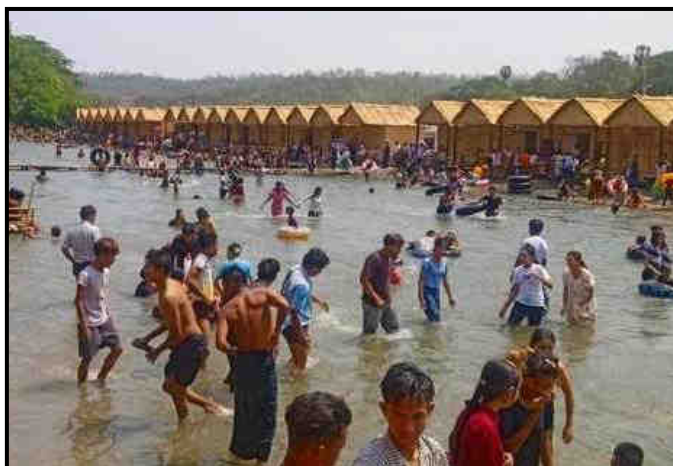
မန်းရွှေစက်တော်