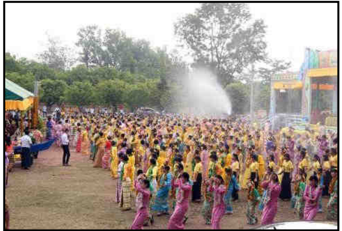
ကရင်ပြည်နယ်တွင် မြန်မာ့ရိုးရာ မဟာအတာသကြီးပွဲတော်ကျင်းပနေမှု