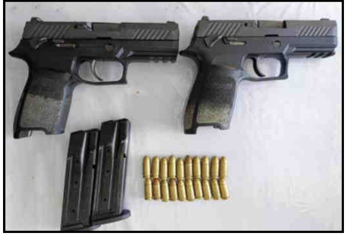
တရားခံ ၃ ဦးနှင့်အတူ သိမ်းဆည်းရမိသည့် လက်နက်/ခဲယမ်းများ မှတ်တမ်းဓာတ်ပုံ