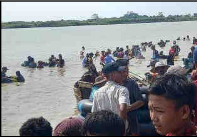
ခနုဖြူမြို့နယ်