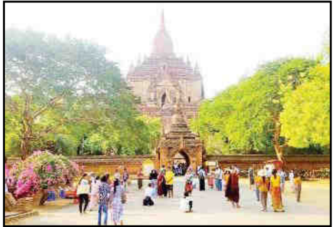
ပုဂံရှေးဟောင်းယဉ်ကျေးမှုနယ်မြေ