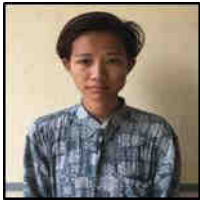
သီရိဝေ(၁)မဝေ