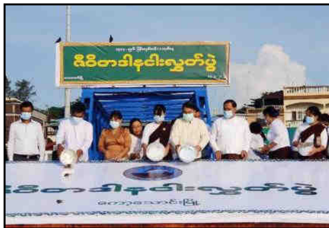
ဇီဝိတဒါန ငါးလွတ်ပွဲပြုလုပ်နေမှု

ဆောက်တည်ခြင်း၊ တိရစ္ဆာန်များအား ဇီဝိတဒါနဘေးမဲ့လွတ်ခြင်း၊ အန္တရာယ်ကင်းပရိတ်တရားတော်များ ရွတ်ဖတ်ပူဇော်ခြင်း၊ သက်ကြီးဘိုးဘွားများ ပူဇော်ကန်တော့ကြပြီး ခေါင်းလျှော်ပေးခြင်း၊ ခြေသည်းလက်သည်းညှပ်ပေးခြင်း၊ စတုဒိသာကျေးမွေးလှူဒါန်းခြင်း၊ ဆွမ်းဆန်စိမ်းလောင်းလှူခြင်းစသည့် ကုသိုလ်ကောင်းမှု အလှူဒါနအစုစုတို့ ကျင်းပကြသည်ကို မြန်မာပြည်အနှံ့ ကြည်