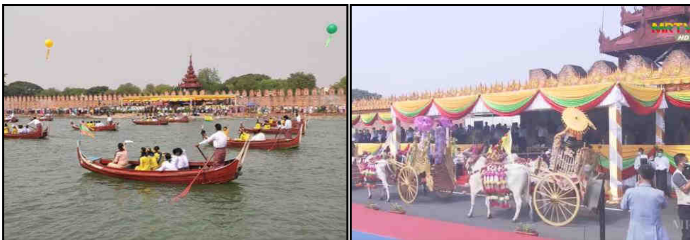
မန်းကျုံးရေပြင် ရတနာပုံခေတ်လှေအလှသရုပ်ပြမှုနှင့် လှည်းယဉ်ကျော့တင်ဆက်နေမှု