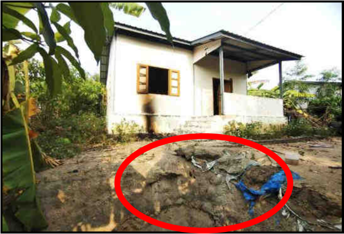
အကြမ်းဖက်အဖွဲ့များ ပြည်သူလူထု၏ နေအိမ်များကို အကာအကွယ်ပြုလုပ်၍ ပစ်ခတ်တိုက်ခိုက်ခဲ့မှု

ကရင်ပြည်နယ်၊ မြဝတီမြို့နယ်၊ လေးကော့ကော်မြို့ သစ်အတွင်း KNU/KNLA အဖွဲ့မှ အကြမ်းဖက်မှုကို လိုလားပြီး NCA ကို ဖျက်ဆီးစေလိုသည့် ခေါင်းဆောင်တစ်ချို့ ပါဝင် သောအဖွဲ့နှင့် PDF အကြမ်းဖက်အဖွဲ့များက လူသားချင်းစာ နာထောက်ထားမှု အကြောင်းအရာအောက်၌ ခိုအောင်းပြီး အကြမ်းဖက်မှုများကို အားပေးအားမြှောက် ပြုလုပ်လျက်ရှိ သဖြင့် တပ်မတော်က ၂၀၂၁ ခုနှစ်၊ ဒီဇင်ဘာလ နောက်ဆုံး အပတ်တွင် လိုအပ်သည့်လုံခြုံရေးလုပ်ငန်းများဆောင်ရွက်ပြီး ဒေသခံပြည်သူများ အေးချမ်းစွာ နေထိုင်နိုင်ရေး ဆောင်ရွက် ပေးခဲ့ပါသည်။