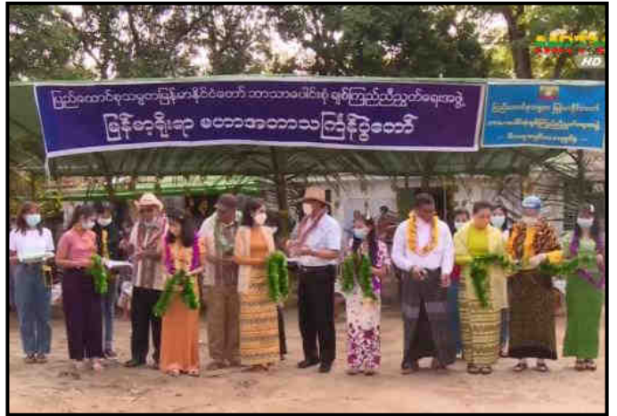
ဘာသာပေါင်းစုံ ချစ်ကြည်ညီညွတ်ရေးအဖွဲ့ မြန်မာ့ရိုးရာ မဟာအတာသကြိမ်ပွဲတော်ကျင်းပနေမှု