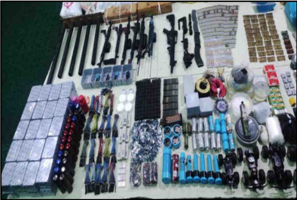
မင်္ဂလာဒုံမြို့နယ်၊ ပုလဲမြို့သစ်၊ ကျွန်းရွှေဝါလမ်းရှိ ရှုမေလ(ခ)ဦးရှင်ကြီး၏နေအိမ်၌ သိမ်းဆည်းရမိသည့် လက်နက်/ခဲယမ်းနှင့် ဖောက်ခွဲပျက်ဆီးရေးပစ္စည်းများ၏ မှတ်တမ်းဓာတ်ပုံ

နိုင်ငံတော်အစိုးရအနေဖြင့် CRPH၊ NUG နှင့် PDF အကြမ်းဖက်အဖွဲ့များမှ ပြည်သူလူထုအား လုပ်ကြံသတ်ဖြတ်ခြင်းနှင့် နိုင်ငံတော်အစိုးရ၏အုပ်ချုပ်မှုယန္တရား ပျက်ပြားစေရန်အတွက် နိုင်ငံတော်အစိုးရနှင့် ချိတ်ဆက်ဆောင်ရွက်လျက်ရှိသည့် ပြည်သူလူထုပိုင် အဆောက်အဦများအား အကြောင်းမဲ့ ဖောက်ခွဲပျက်ဆီးခြင်း၊ သင်္ကြန်ကာလအတွင်း အပြစ်မဲ့ပြည်သူများအား ထိတ်လန့်ကြောက်ရွံ့စေရန် ဖောက်ခွဲပျက်ဆီးခြင်း စသည့် အကြမ်းဖက်လုပ်ရပ်များအား ဆောင်ရွက်နိုင်မှုမရှိစေရေး ဖော်ထုတ်ဖမ်းဆီးခြင်းများအား နေ့/ညမပြတ် ဆောင်ရွက်လျက်ရှိသည်။