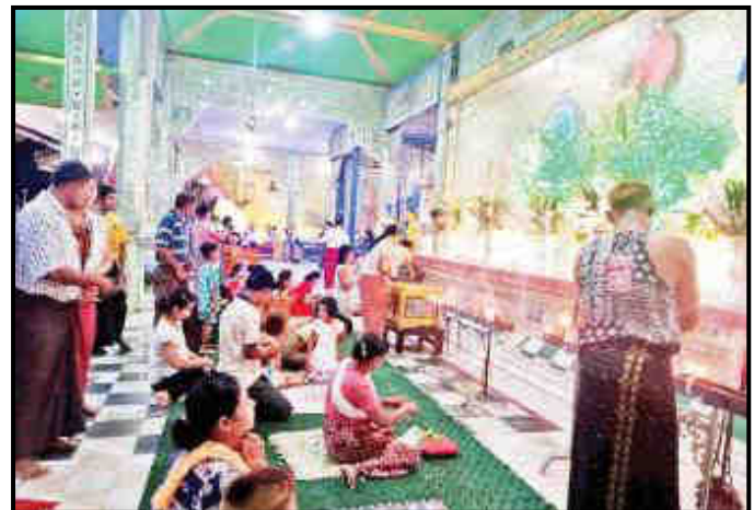
ပေါင်မြို့နယ်