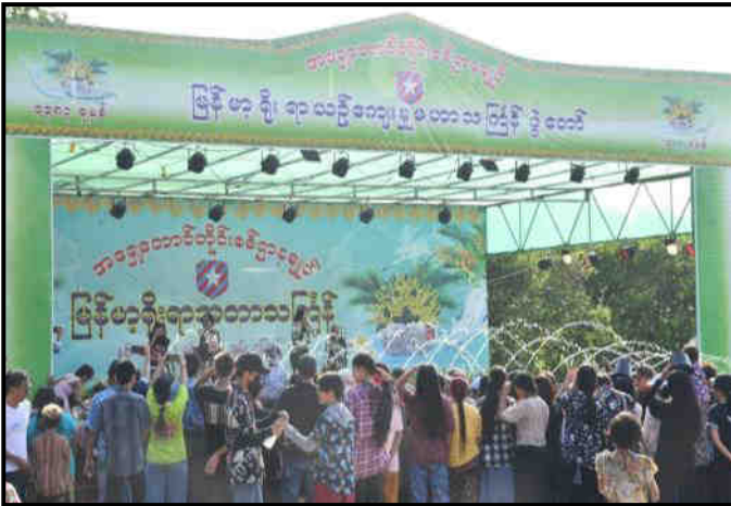
အရှေ့တောင်တိုင်းစစ်ဌာနချုပ်