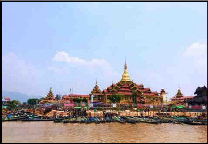
အင်းလေးဖောင်တော်ဦးစေတီ