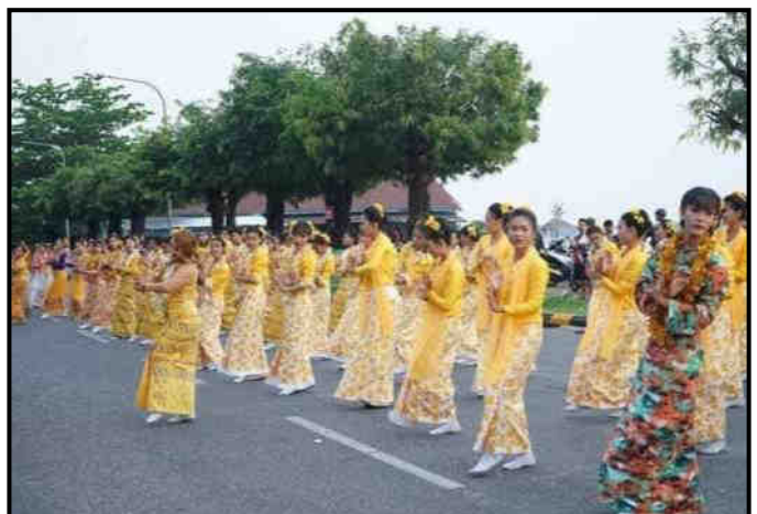
မွန်ပြည်နယ်တွင် မဟာအတာသကြီးပွဲတော်ကျင်းပနေမှု