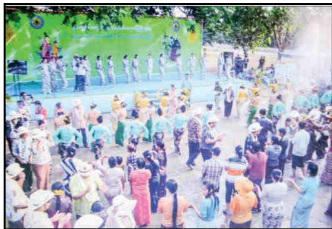
ပို့ဆောင်ရေးနှင့် ဆက်သွယ်ရေးဝန်ကြီးဌာန မိသားစု အတာရေသဘင်ပွဲ ဆင်နွှဲနေမှု

ပေါ်၊ ရွှေရင်အေး၊ မုန့်လက်ဆောင်း၊ မုန့်ဟင်းခါး၊ သင်္ကြန်ထမင်း တို့ဖြင့် တည်ခင်းဧည့်ခံခဲ့ကြောင်းနှင့် တက်ရောက်လာသည့် ဝန်ထမ်းများနှင့် မိသားစုများက သင်္ကြန်သီချင်းများနှင့် သီဆို