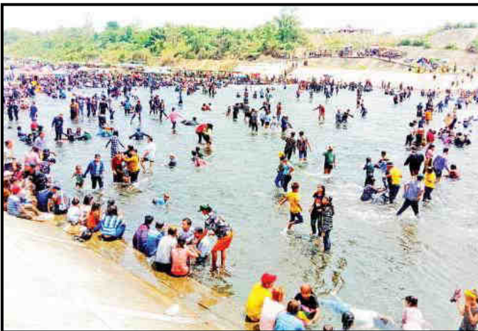
ဖြူးချောင်းအပန်းဖြေစခန်း