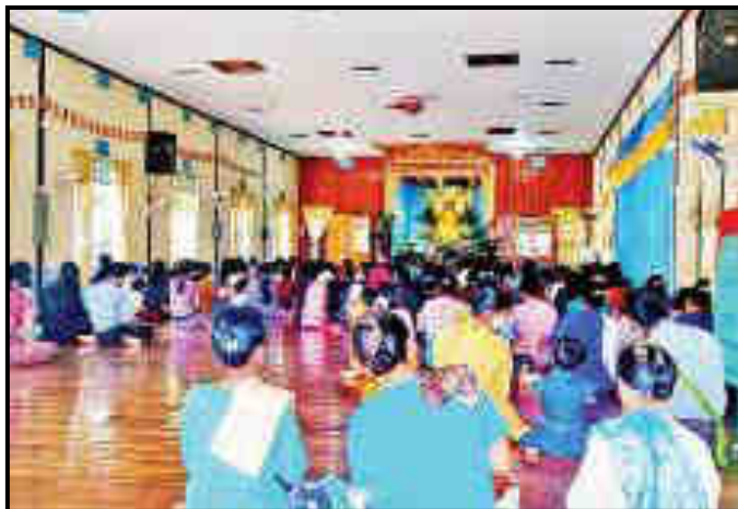
ဟိုပုံးမြို့နယ်