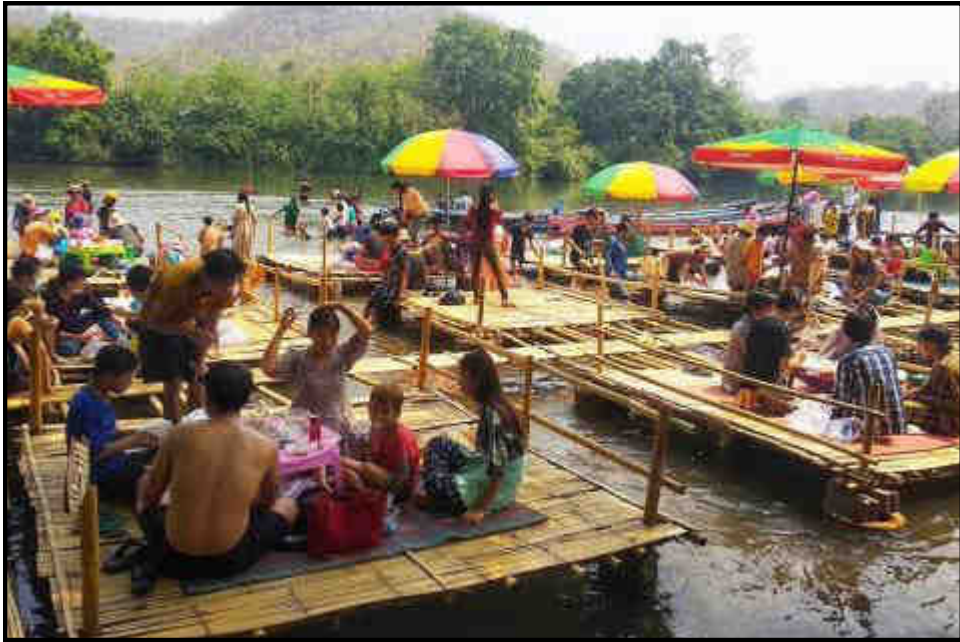
သီပေါမြို့နယ်၊ ဒုဋ္ဌဝတီမြစ်ကမ်းခြေရှိ သီပေါချောင်းသာ အပန်းဖြေစခန်း၌ အများပြည်သူများ အပန်းဖြေနေမှု

မြန်မာ့ရိုးရာမဟာသင်္ကြန်ပွဲတော်ကာလများတွင် တန်ခိုးကြီးဘုရားစေတီပုထိုးများ၌ ကုသိုလ်ကောင်းမှုပြုကြသူများ၊ စတုဒိသာကျွေးမွေးလှူဒါန်းကြသူများ၊ အေးချမ်းပျော်ရွှင်စွာ ရေကစားကြသူများနှင့် အပန်းဖြေစခန်းများ၌ လာရောက်အပန်းဖြေကြသူများဖြင့် စည်ကားလျက်ရှိပါသည်။