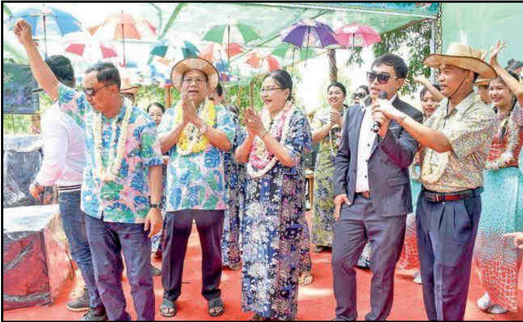
နိုင်ငံတော်စီမံအုပ်ချုပ်ရေးကောင်စီအဖွဲ့ဝင် ဒေါ်အေးနုစိန်က အဖွဲ့ဝင်များနှင့်အတူ စစ်တွေမြို့၊ မဟာသကြိမ်ဗဟိုမဏ္ဍပ်တွင် ပျော်ရွှင်စွာ ဆင်နွှဲနေမှု

မြန်မာသက္ကရာဇ် ၁၃၈၃ ခုနှစ်၊ မြန်မာ့ရိုးရာ မဟာသကြိမ်ပွဲတော်ကို ဧပြီလ ၁၃ ရက် သကြိမ်အကြိုနေ့မှ ဧပြီလ ၁၆ ရက် သကြိမ်အတက်နေ့အထိ တိုင်းဒေသကြီးနှင့် ပြည်နယ်အသီးသီးတွင် ကျင်းပပြုလုပ်ခဲ့ရာ နိုင်ငံတစ်ဝန်းရှိပြည်သူများက အေးချမ်းပျော်ရွှင်စွာ သကြိမ်ရေကစားခဲ့ကြပါသည်။