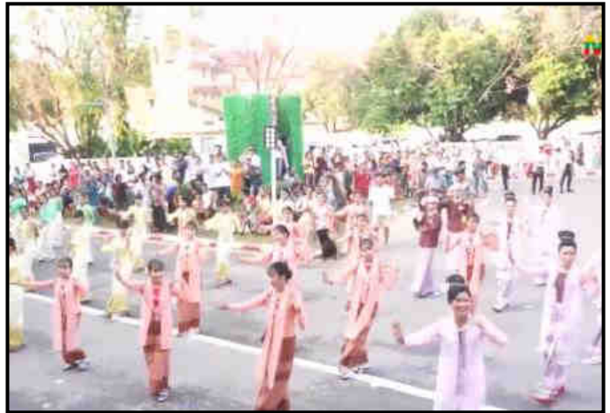
တနင်္သာရီတိုင်းဒေသကြီးတွင် မြန်မာ့ရိုးရာ မဟာအတာသကြီးပွဲတော်ကျင်းပနေမှု