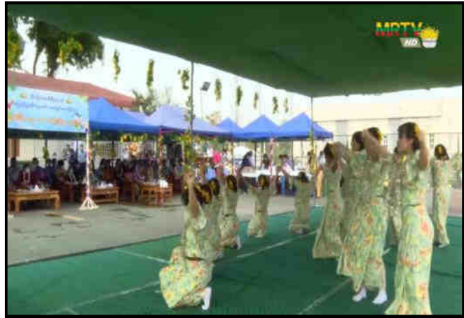
နိုင်ငံခြားရေးဝန်ကြီးဌာနနှင့် အပြည်ပြည်ဆိုင်ရာ ပူးပေါင်းဆောင်ရွက်ရေးဝန်ကြီးဌာနတို့၏ မိသားစု အတာရေသဘင်ပွဲ ဆင်နွှဲနေမှု