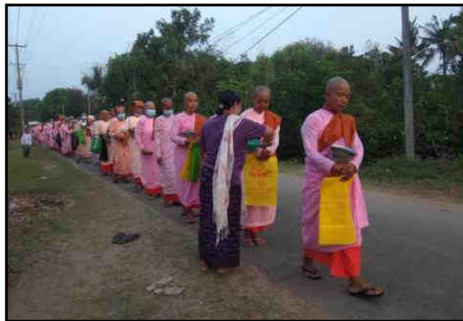
သံဃာတော်အရှင်သူမြတ်များနှင့် သီလရှင်များအား ဆွမ်းဆန်စိမ်းလောင်းလှူနေမှု