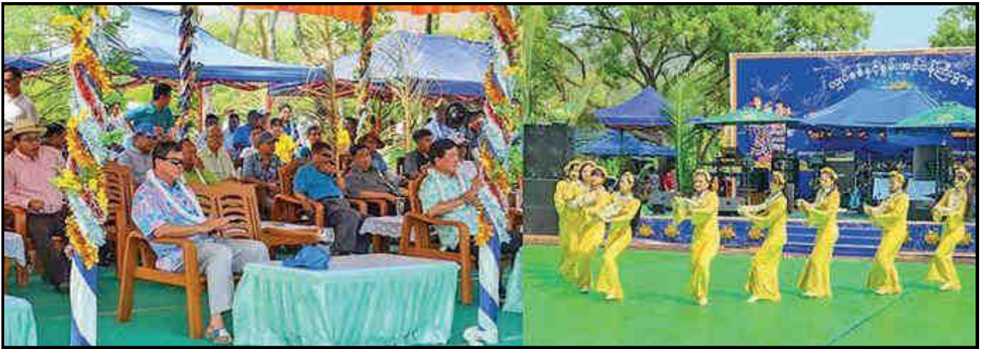
လျှပ်စစ်နှင့် စွမ်းအင်ဝန်ကြီးဌာန မိသားစု အတာရေသဘင်ပွဲ ဆင်နွှဲနေမှု