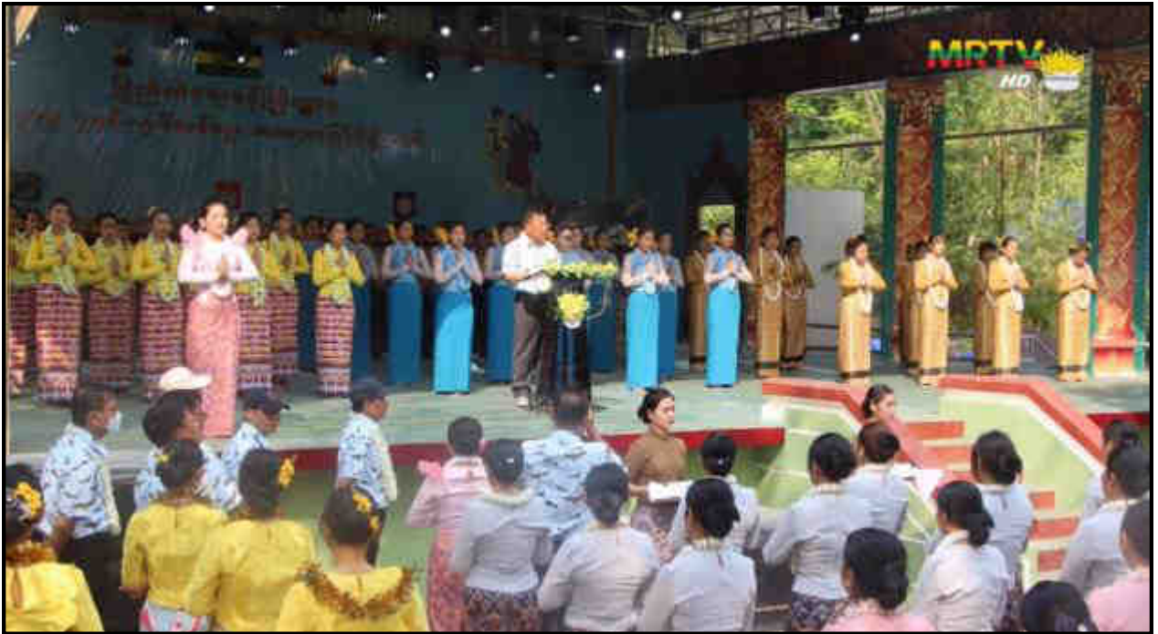
ပြည်ထဲရေးဝန်ကြီးဌာန ပြည်ထောင်စုဝန်ကြီးက ပြည်ထဲရေးဝန်ကြီးဌာန၊ မိသားစုအတာရေသဘင်မဏ္ဍပ်ကို ဖွင့်လှစ်ပေးနေမှု

မြန်မာသက္ကရာဇ် ၁၃၈၃ ခုနှစ်တွင် ကျရောက်သည့် မဟာသင်္ကြန်အတာရေသဘင်ပွဲတော်တွင် ဌာနဆိုင်ရာမိသားစုများအနေဖြင့် စိတ်အပန်းဖြေပျော်ရွှင်စွာဖြင့် ရေကစားနိုင်ရန်အတွက် ဝန်ကြီးဌာနများအလိုက် ရေကစားမဏ္ဍပ်များ၌ မြန်မာ့ရိုးရာရေသဘင်ပွဲတော်ကို ကျင်းပပြုလုပ်ခဲ့ရာ ပြည်ထောင်စုဝန်ကြီးများနှင့်ဇနီးများ၊ ညွှန်ကြားရေးမှူးချုပ်များ၊ ဦးဆောင်ညွှန်ကြားရေးမှူးများနှင့် ၎င်းတို့၏ဇနီးများ၊ အရာထမ်း၊ အမှုထမ်းများနှင့် မိသားစုဝင်များ ပျော်ရွှင်စွာဆင်နွှဲခဲ့ကြပါသည်။