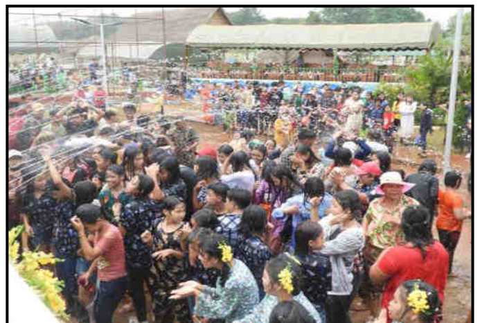
အရှေ့မြောက်တိုင်းစစ်ဌာနချုပ်