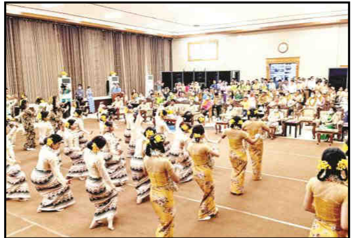
ဆောက်လုပ်ရေးဝန်ကြီးဌာန မိသားစု အတာရေသဘင်ပွဲ ဆင်နွှဲနေမှု