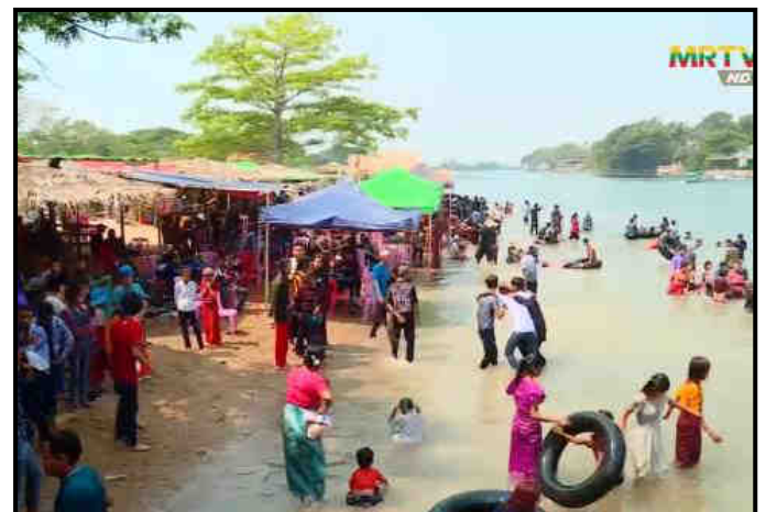
လှေခွင်းတောင်အပန်းဖြေစခန်း