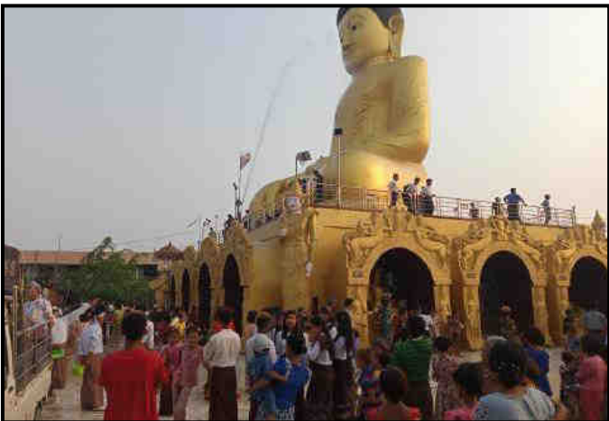
ကျောက်တော်မြို့နယ်