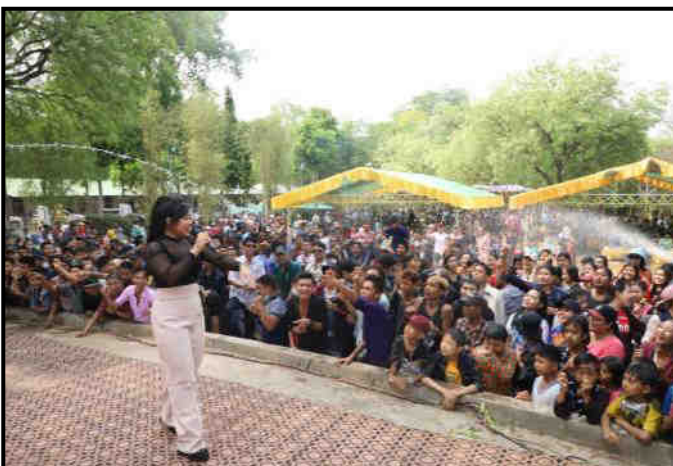
အနောက်မြောက်တိုင်းစစ်ဌာနချုပ်