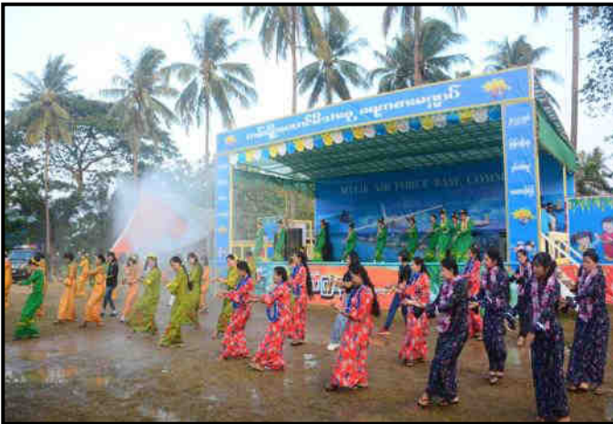
ကမ်းရိုးတန်းဒေသတိုင်းစစ်ဌာနချုပ်