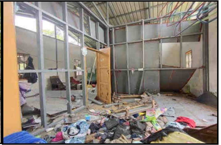
အကြမ်းဖက်အဖွဲ့များ ပြည်သူလူထု၏ နေအိမ်များကို အကာအကွယ်ပြုလုပ်၍ ပစ်ခတ်တိုက်ခိုက်ခဲ့မှုမှတ်တမ်းဓာတ်ပုံများ