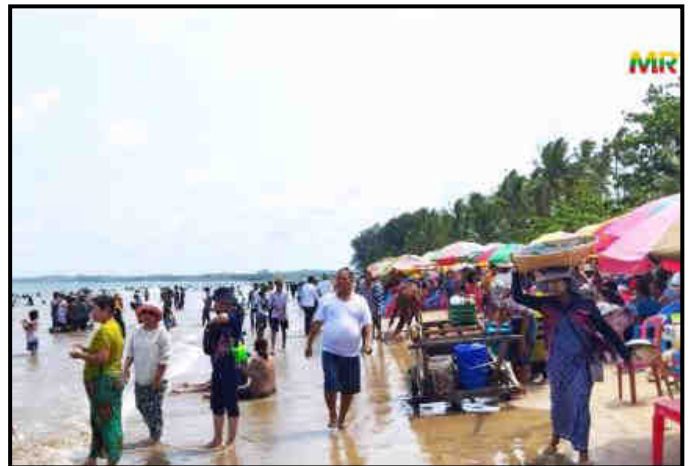
ငွေဆောင်ကမ်းခြေ