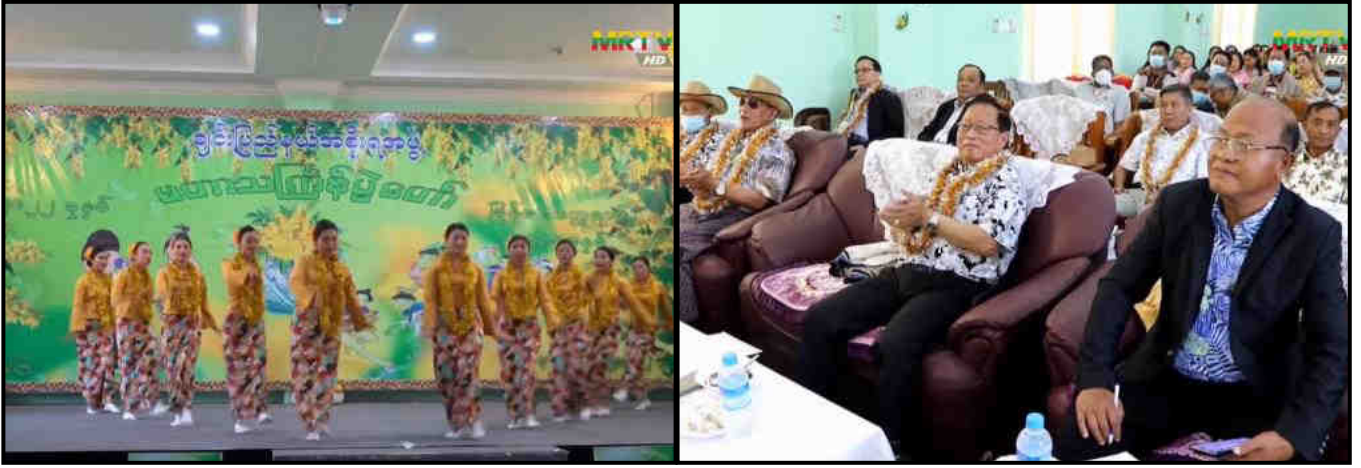
ချင်းပြည်နယ်ဝန်ကြီးချုပ် ဦးငွန်ဆန်းအောင် ဟားခါးမြို့၌ မြန်မာ့ရိုးရာနှစ်သစ်ကူး အတာသင်္ကြန်ပွဲတော် အကြတ်နေ့ကျင်းပနေမှုအား တက်ရောက်ကြည့်ရှုအားပေးနေမှု

သင်္ကြန်မဏ္ဍပ်များတွင် ဝန်ကြီးချုပ်နှင့် တာဝန်ရှိသူများက ရေသဘင်ပွဲဆင်နွှဲနေမှုများကို ကြည့်ရှုစစ်ဆေးခဲ့။