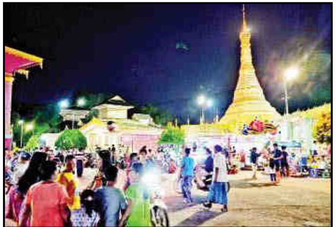
မုဒုံမြို့နယ်