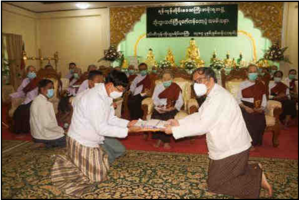
ရန်ကုန်တိုင်းဒေသကြီးတွင် သက်ကြီးပူဇော်ပွဲကျင်းပပြုလုပ်နေမှု

မြန်မာသက္ကရာဇ် ၁၃၈၃ ခုနှစ် နှစ်ဟောင်းကုန်လွန်၍ ၁၃၈၄ ခုနှစ် မြန်မာနှစ်ဆန်းတစ်ရက်နေ့ အခါသမယတွင် နိုင်ငံတစ်ဝန်း၌ ယဉ်ကျေးမှုမလေ့ထုံးတမ်းစဉ်လာမပျက် ကုသိုလ်ကောင်းမှုပြုသူများဖြင့် ကြိတ်ကြိတ်တိုး စည်းကားခဲ့ပါသည်။