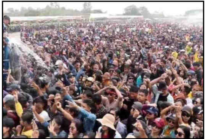
ပဲခူးတိုင်းဒေသကြီးတွင် မြန်မာ့ရိုးရာ မဟာအတာသကြိမ်ပွဲတော်ကျင်းပနေမှု