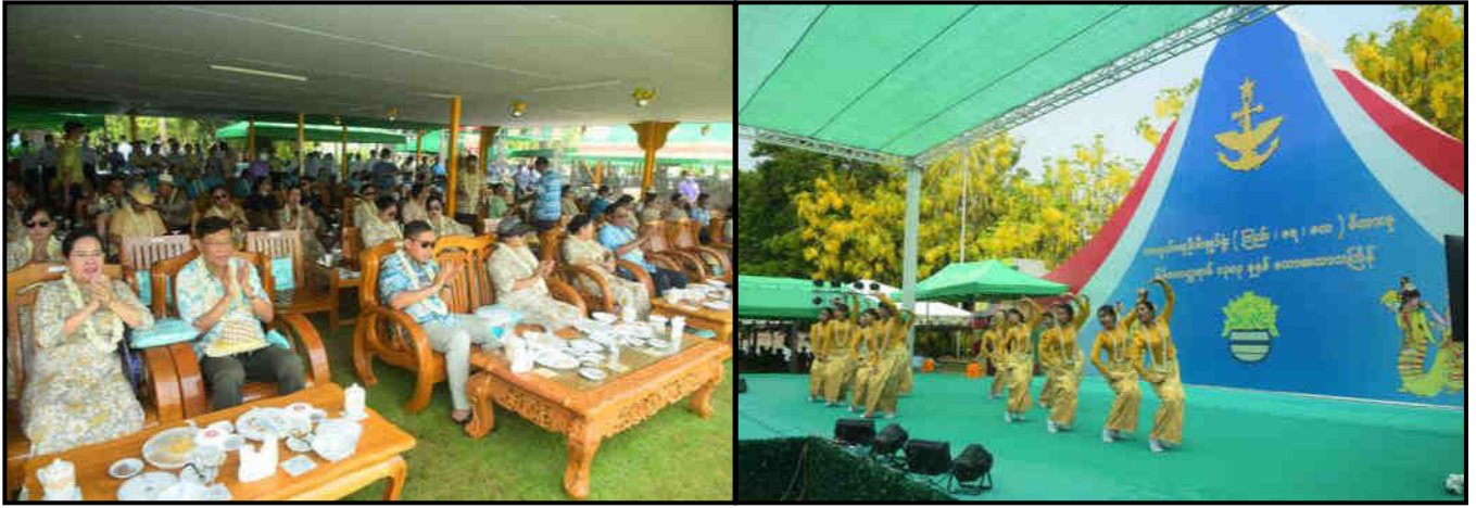
နိုင်ငံတော်စီမံအုပ်ချုပ်ရေးကောင်စီဒုတိယဥက္ကဋ္ဌ ဒုတိယတပ်မတော်ကာကွယ်ရေးဦးစီးချုပ်က ကာကွယ်ရေးဦးစီးချုပ်ရုံး(ကြည်း၊ ရေ၊ လေ) မိသားစုရေကစားမဏ္ဍပ်၌ ယိမ်းအဖွဲ့များ ကပြဖျော်ဖြေနေမှုအား ကြည့်ရှုအားပေးနေမှု