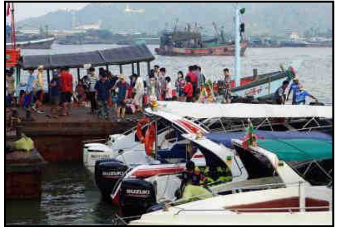
မြိတ်မြို့နယ်