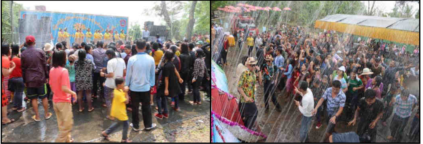
မြောက်ပိုင်းတိုင်းစစ်ဌာနချုပ် မိသားစုရေကစားမဏ္ဍပ်၌ ပြည်သူများ ပျော်ရွှင်စွာ ရေကစားနေမှု

မြန်မာသက္ကရာဇ် ၁၃၈၃ ခုနှစ်၊ မြန်မာ့ရိုးရာ မဟာ သင်္ကြန်ပွဲတော်ကို တိုင်းဒေသကြီးနှင့် ပြည်နယ်များရှိ တိုင်းစစ်ဌာနချုပ်များ၌ ဧပြီလ ၁၃ ရက်မှ ၁၆ ရက်အထိကျင်းပခဲ့ရာ နိုင်ငံတော်စီမံအုပ်ချုပ်ရေးကောင်စီ အဖွဲ့ဝင်များ၊ တိုင်းဒေသကြီးနှင့် ပြည်နယ်များမှ ဝန်ကြီးချုပ်များ၊ တိုင်းမှူးများ၊ တိုင်းစစ်ဌာနချုပ်များမှ အရာရှိ၊ စစ်သည်၊ မိသားစုဝင်များ၊ ယိမ်းအက အဖွဲ့များ ပါဝင်ဆင်နွှဲခဲ့ကြပါသည်။