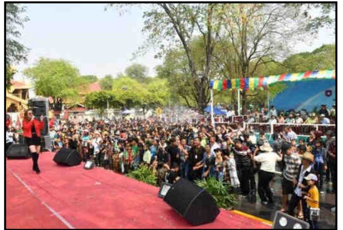
အလယ်ပိုင်းတိုင်းစစ်ဌာနချုပ်