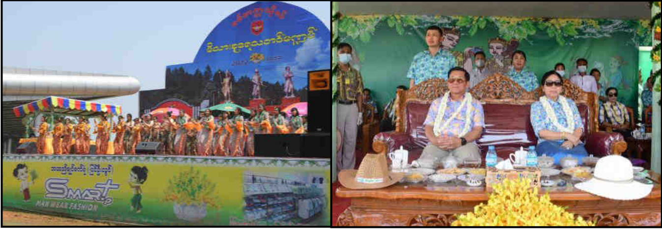
နိုင်ငံတော်စီမံအုပ်ချုပ်ရေးကောင်စီဥက္ကဋ္ဌ တပ်မတော်ကာကွယ်ရေးဦးစီးချုပ်နှင့် ဇနီးတို့က စစ်တက္ကသိုလ်မိသားစု အတာရေသဘင်မဏ္ဍပ်၌ ယိမ်းအဖွဲ့များ၏ သီဆိုဖျော်ဖြေမှုများကို ကြည့်ရှုအားပေးနေမှု

နိုင်ငံတော်စီမံအုပ်ချုပ်ရေးကောင်စီဥက္ကဋ္ဌ တပ်မတော်ကာကွယ်ရေးဦးစီးချုပ် ဗိုလ်ချုပ်မှူးကြီး မင်းအောင်လှိုင်နှင့် ဇနီး ဒေါ်ကြူကြူလှသည် ပြင်ဦးလွင်တပ်နယ်ရှိ မိသားစုရေသဘင်မဏ္ဍပ်များသို့ သွားရောက်ကြည့်ရှုအားပေး