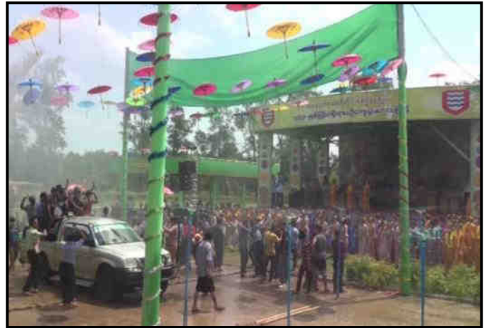
အနောက်တောင်တိုင်းစစ်ဌာနချုပ်