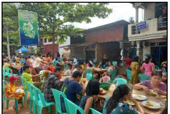
ရှောဝတီတိုင်းဒေသကြီးတွင် မဟာအတာသကြိမ်ပွဲတော်ကျင်းပနေမှု