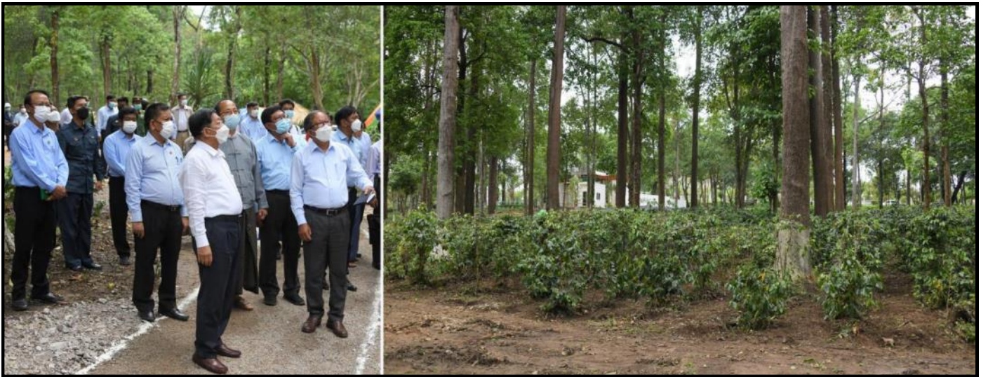
နိုင်ငံတော်စီမံအုပ်ချုပ်ရေးကောင်စီဥက္ကဋ္ဌ နိုင်ငံတော်ဝန်ကြီးချုပ်က ပြင်ဦးလွင်ကော်ဖီဥယျာဉ်အတွင်းဆောင်ရွက်ထားရှိမှုအခြေအနေများအား လိုက်လံကြည့်ရှုစစ်ဆေးနေမှု