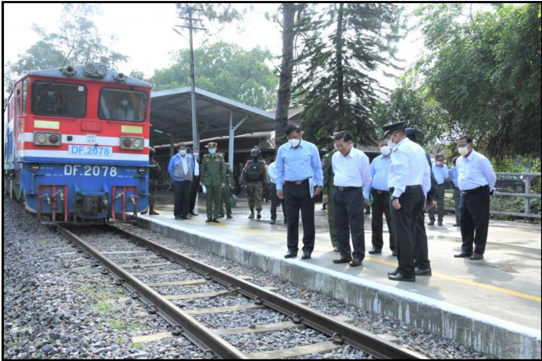
နိုင်ငံတော်စီမံအုပ်ချုပ်ရေးကောင်စီဥက္ကဋ္ဌ နိုင်ငံတော်ဝန်ကြီးချုပ်က ပြင်ဦးလွင်ဘူတာကြီးတွင် ကြည့်ရှုစစ်ဆေးနေမှု

နိုင်ငံတော်စီမံအုပ်ချုပ်ရေးကောင်စီဥက္ကဋ္ဌ နိုင်ငံတော် ဝန်ကြီးချုပ် ဗိုလ်ချုပ်မှူးကြီး မင်းအောင်လှိုင်သည် တာဝန်ရှိသူ များနှင့်အတူ ဧပြီလ ၁၉ ရက်တွင် ပြင်ဦးလွင်မြို့ ဘူတာကြီး သို့ သွားရောက်၍ ဘူတာအတွင်း လှည့်လည်ကြည့်ရှုစစ်ဆေး ရာ တာဝန်ရှိသူများက လိုက်လံရှင်းလင်းတင်ပြခဲ့ကြပါသည်။