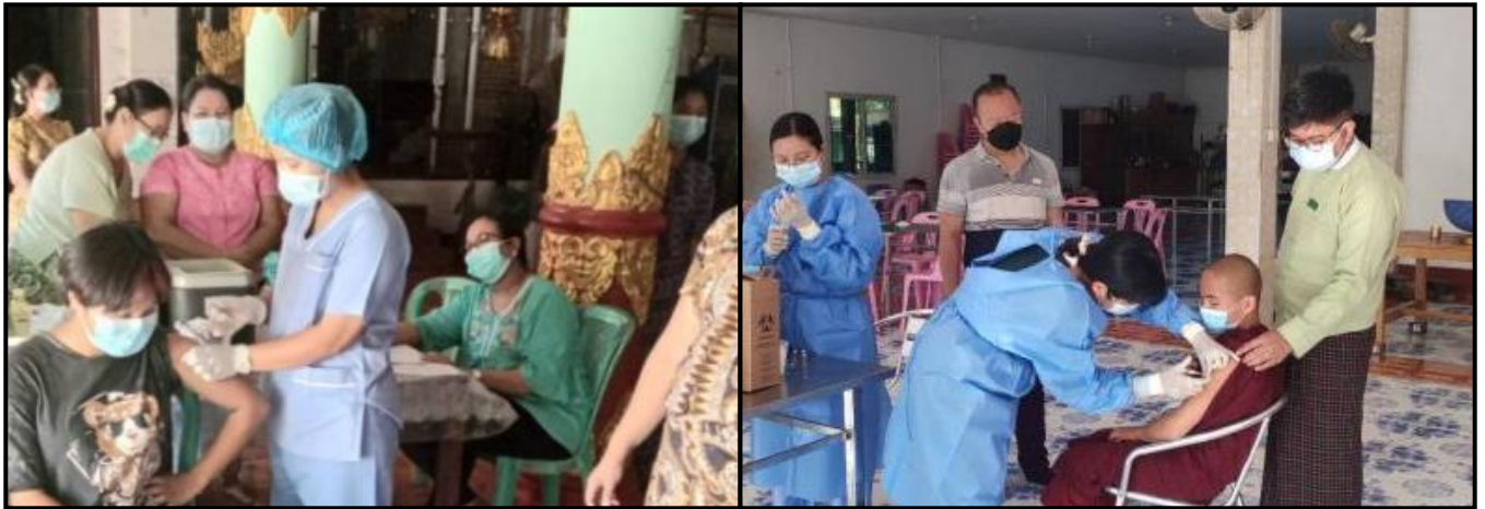
တိုင်းဒေသကြီးနှင့် ပြည်နယ်အသီးသီးတွင် ကိုဗစ်-၁၉ ရောဂါ ကာကွယ်ဆေးများ ထိုးနှံပေးနေမှု

ကိုဗစ်-၁၉ ရောဂါ ကာကွယ်၊ ထိန်းချုပ်၊ ကုသရေးလုပ်ငန်းများဆောင်ရွက်လျက်ရှိသော Quarantine Center များအား ဆက်လက်ဖွင့်လှစ်ပေးခြင်းနှင့် ကိုဗစ်-၁၉ ရောဂါ ကာကွယ်ဆေးထိုးပေးခြင်းတို့အား တိုင်းဒေသကြီးနှင့် ပြည်နယ်အသီးသီး၌ ဆက်လက်ဆောင်ရွက်လျက်ရှိပါသည်-