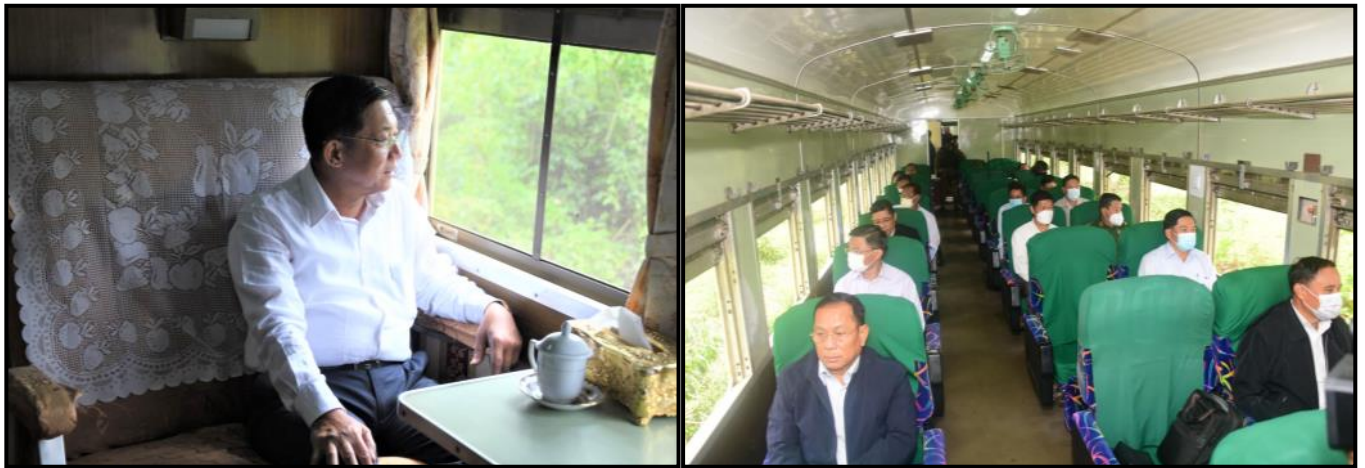
နိုင်ငံတော်စီမံအုပ်ချုပ်ရေးကောင်စီဥက္ကဋ္ဌ နိုင်ငံတော်ဝန်ကြီးချုပ်နှင့်အဖွဲ့များက ပြင်ဦးလွင်ဘူတာကြီးမှ မီးပင်ကြီးဘူတာသို့ လိုက်ပါစီးနင်းနေမှု