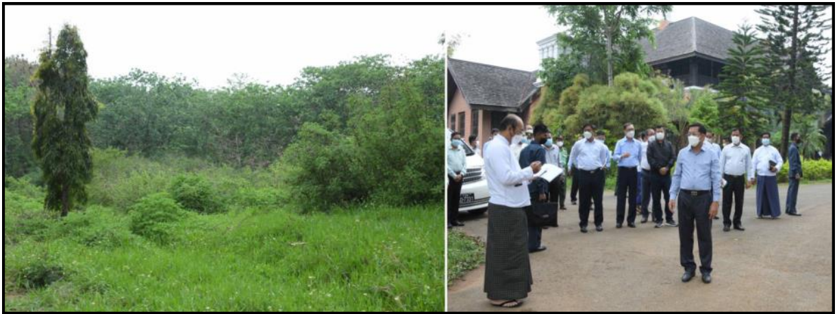
နိုင်ငံတော်စီမံအုပ်ချုပ်ရေးကောင်စီဥက္ကဋ္ဌ နိုင်ငံတော်ဝန်ကြီးချုပ်က ဘုရင်ခံအိမ်တော် (Governor House) ပတ်ဝန်းကျင်အား ကြည့်ရှုစစ်ဆေးနေမှု