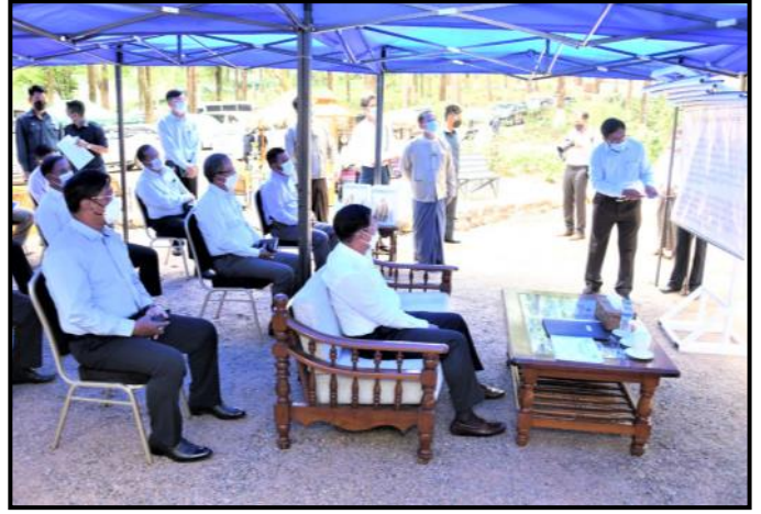
နိုင်ငံတော်စီမံအုပ်ချုပ်ရေးကောင်စီဥက္ကဋ္ဌ နိုင်ငံတော်ဝန်ကြီးချုပ်အား တာဝန်ရှိသူတစ်ဦးက ကော်ဖီဥယျာဉ်ဆောင်ရွက်နေမှု အခြေအနေများအား ရှင်းလင်းတင်ပြနေမှု