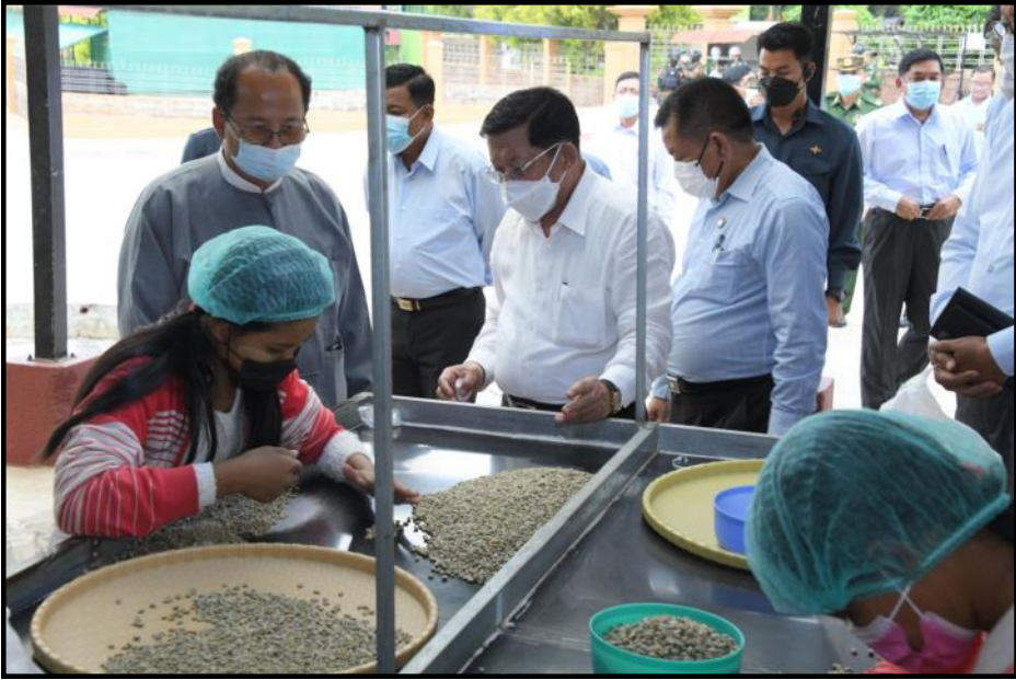
နိုင်ငံတော်စီမံအုပ်ချုပ်ရေးကောင်စီဥက္ကဋ္ဌ နိုင်ငံတော်ဝန်ကြီးချုပ်က ကော်ဖီအဆင့်လိုက် သို့လှောင်ခြင်းလုပ်ငန်းများကို ကြည့်ရှုလေ့လာနေမှု

နိုင်ငံတော်စီမံအုပ်ချုပ်ရေးကောင်စီဥက္ကဋ္ဌ နိုင်ငံတော် ဝန်ကြီးချုပ် ဗိုလ်ချုပ်မှူးကြီး မင်းအောင်လှိုင်သည် အဖွဲ့ဝင် များနှင့်အတူ ဧပြီလ ၁၉ ရက်တွင် ပြင်ဦးလွင်မြို့ရှိ မြန်မာနိုင်ငံ ကော်ဖီအသင်း (Myanmar Coffee Association) နှင့် ပြင်ဦး လွင်ကော်ဖီဥယျာဉ် (Pyin Oo Lwin Coffee Park) ဆောင်ရွက် နေမှုအခြေအနေများကို သွားရောက်ကြည့်ရှုစစ်ဆေးခဲ့ပါသည်။