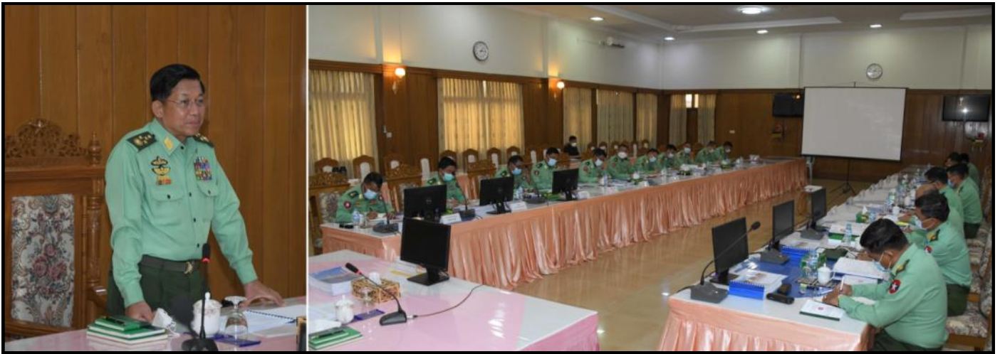
နိုင်ငံတော်စီမံအုပ်ချုပ်ရေးကောင်စီဥက္ကဋ္ဌ တပ်မတော်ကာကွယ်ရေးဦးစီးချုပ်က တက္ကသိုလ်နှင့် လေ့ကျင့်ရေးကျောင်းများ၏ လေ့ကျင့်ရေးဆိုင်ရာ ညှိနှိုင်းအစည်းအဝေးတွင် လမ်းညွှန်အမှာစကားပြောကြားနေမှု

ပြင်ဦးလွင်တပ်နယ်ရှိ တက္ကသိုလ်နှင့် လေ့ကျင့်ရေးကျောင်းများ၏ လေ့ကျင့်ရေးဆိုင်ရာ ညှိနှိုင်းအစည်းအဝေးကို ဧပြီလ ၁၈ ရက်တွင် ပြင်ဦးလွင်မြို့ရှိ တပ်မတော်ဧည့်ဂေဟာ အစည်းအဝေးခန်းမ၌ ကျင်းပပြုလုပ်ခဲ့ရာ နိုင်ငံတော်စီမံအုပ်ချုပ်ရေးကောင်စီဥက္ကဋ္ဌ တပ်မတော်ကာကွယ်ရေးဦးစီးချုပ် ဗိုလ်ချုပ်မှူးကြီး မင်းအောင်လှိုင် တက်ရောက်အမှာစကားပြောကြားခဲ့ရာတွင်-