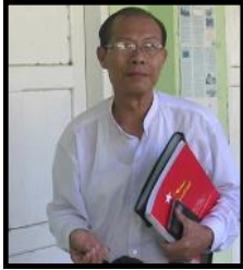
နေပြည်တော်စည်ပင်သာယာရေး ကော်မတီဥက္ကဋ္ဌနှင့် မြို့တော်ဝန်ဟောင်း ဒေါက်တာမျိုးအောင်