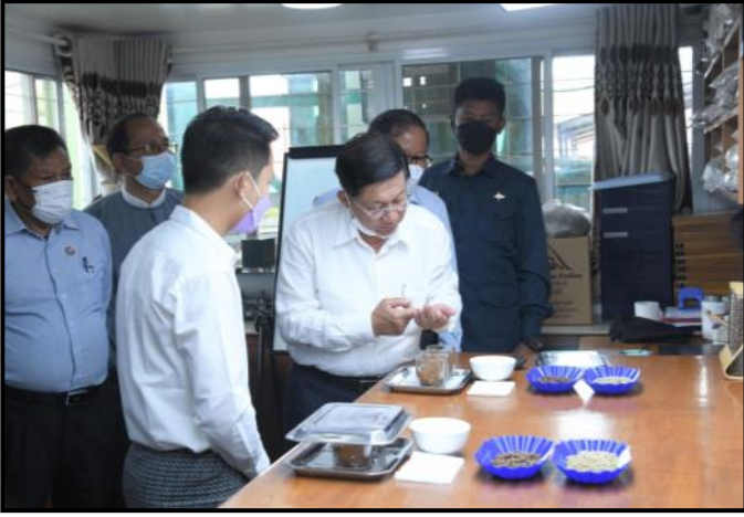
နိုင်ငံတော်စီမံအုပ်ချုပ်ရေးကောင်စီဥက္ကဋ္ဌ နိုင်ငံတော်ဝန်ကြီးချုပ်က ကော်ဖီအရည်အသွေးအား လေ့လာကြည့်ရှုနေမှု