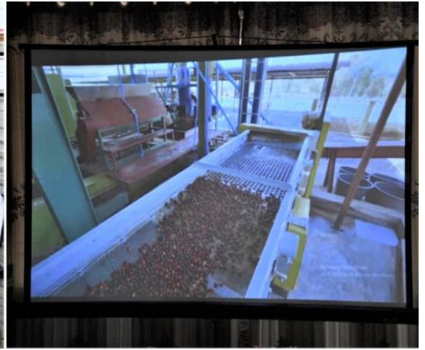
နိုင်ငံတော်စီမံအုပ်ချုပ်ရေးကောင်စီဥက္ကဋ္ဌ နိုင်ငံတော်ဝန်ကြီးချုပ်အား တာဝန်ရှိသူတစ်ဦးက ကော်ဖီထုတ်လုပ်ပုံအဆင့်ဆင့်ကို Video Clip ဖြင့် ရှင်းလင်းတင်ပြနေမှု

ကြောင်းပြောကြားပြီး အခြားသိရှိလိုသည်များနှင့် လိုအပ်သည်များကို မေးမြန်းဆွေးနွေးပြောကြားခဲ့။