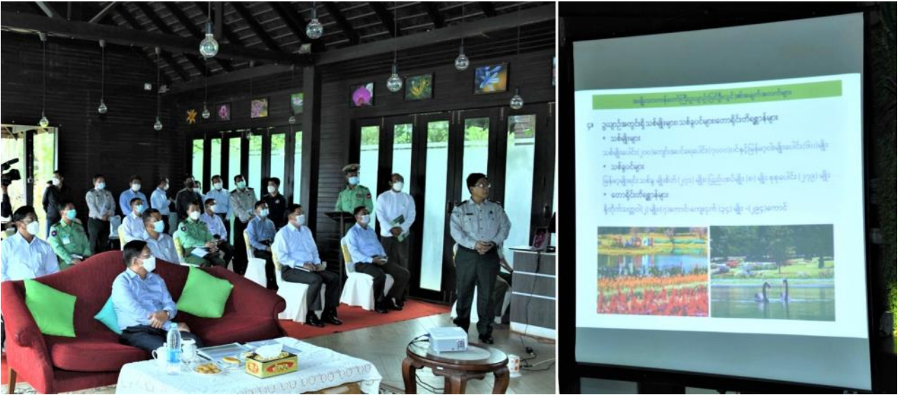
နိုင်ငံတော်စီမံအုပ်ချုပ်ရေးကောင်စီဥက္ကဋ္ဌ နိုင်ငံတော်ဝန်ကြီးချုပ်က တာဝန်ရှိသူများက အမျိုးသားကန်တော်ကြီးဥယျာဉ်ဆိုင်ရာအချက်အလက်များနှင့်ပတ်သက်၍ ရှင်းလင်းတင်ပြနေမှု