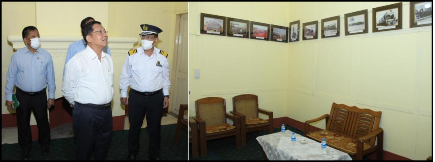
နိုင်ငံတော်စီမံအုပ်ချုပ်ရေးကောင်စီဥက္ကဋ္ဌ နိုင်ငံတော်ဝန်ကြီးချုပ်က ပြင်ဦးလွင်ဘူတာရုံအဆောက်အဦအတွင်း ကြည့်ရှုစစ်ဆေးနေမှု