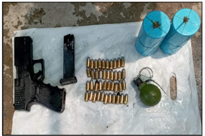
၂၀၂၂ ခုနှစ် ၊ ဧပြီလ ၁၄ ရက်တွင် ပြည်ကြီးတံခွန်မြို့နယ်၊ ၁၁၃ x ၁၁၄ လမ်းကြား၌ သိမ်းဆည်းရမိခဲ့သည့် လက်လုပ်သေနတ် ၂ လက်နှင့် ဆက်စပ်ပစ္စည်းများ