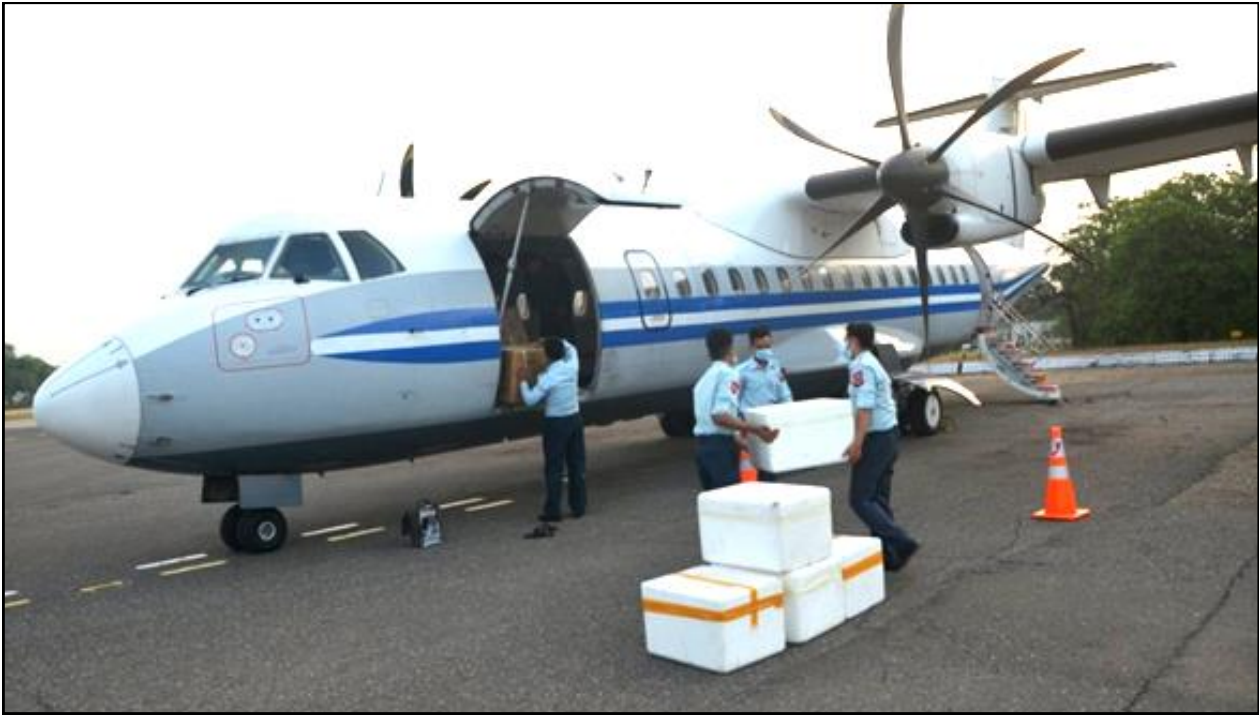
ကိုဗစ်-၁၉ ရောဂါကာကွယ်ဆေးများအား တိုင်းဒေသကြီးနှင့်ပြည်နယ်အသီးသီးသို့ တပ်မတော်လေယာဉ်များဖြင့် ပို့ဆောင်ဖြန့်ဖြူးပေးနေမှု

ကိုဗစ်-၁၉ ရောဂါ ကာကွယ်၊ ထိန်းချုပ်၊ ကုသရေးလုပ်ငန်းများ ဆောင်ရွက်လျက်ရှိ သော Quarantine Center များအား ဆက်လက်ဖွင့်လှစ်ပေးခြင်းနှင့် ကိုဗစ်-၁၉ ရောဂါကာကွယ်ဆေးထိုးပေးခြင်းတို့အား တိုင်းဒေသကြီးနှင့် ပြည်နယ်အသီးသီး၌ ဆက်လက်ဆောင်ရွက်လျက်ရှိပါသည်-