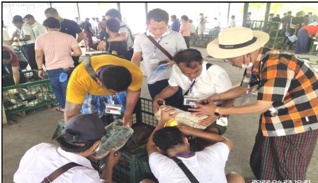
(၅၇) ကြိမ်မြောက် မြန်မာ့ကျောက်မျက်ရတနာပြပွဲ ခင်းကျင်းပြသရောင်းချနေသည့် မှတ်တမ်းဓာတ်ပုံများ