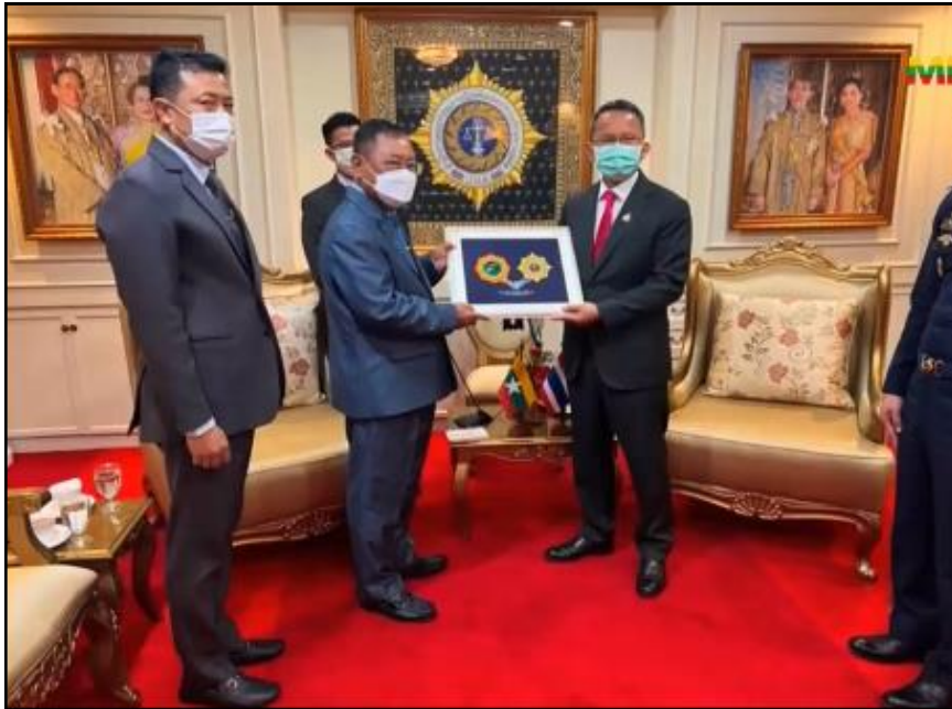
ပြည်ထောင်စုဝန်ကြီး ဒုတိယဗိုလ်ချုပ်ကြီးစိုးထွဋ်က ထိုင်းနိုင်ငံ တရားရေးဝန်ကြီးအား အမှတ်တရလက်ဆောင်ပစ္စည်းပေးအပ်နေမှု