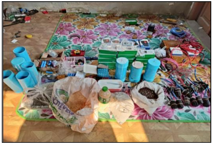
၂၀၂၂ ခုနှစ် ၊ ဧပြီလ ၉ ရက်တွင် မဟာအောင်မြေမြို့နယ်၊ ရဲမွန်တောင်ရပ်ကွက်ရှိ နေအိမ်၌ သိမ်းဆည်းရမိခဲ့သည့် လက်နက်/ခဲယမ်းများ