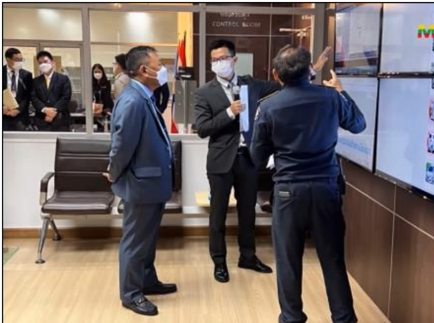
ပြည်ထောင်စုဝန်ကြီး ဒုတိယဗိုလ်ချုပ်ကြီးစိုးထွဋ်က မူးယစ်ဆေးဝါးတားဆီးနှိမ်နင်းရေးလုပ်ငန်းများတွင် ခေတ်မီနည်းပညာအသုံးပြု ဖော်ထုတ်ဆောင်ရွက်နေမှုအား ကြည့်ရှုလေ့လာနေမှု