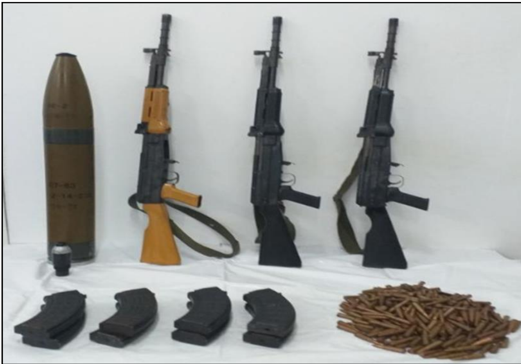
၂၀၂၂ ခုနှစ်၊ ဧပြီလ ၂၀ ရက်တွင် ချမ်းမြသာစည်မြို့နယ်၊ ၁၀၉(အေ)လမ်း၊ ၅၃x၅၄ လမ်းကြားရှိ နေအိမ်၌ သိမ်းဆည်းရမိခဲ့သည့် လက်နက်/ခဲယမ်းများ

နိုင်ငံတော်အစိုးရအနေဖြင့် CRPH၊ NUG နှင့် PDF အကြမ်းဖက်အဖွဲ့များမှ ပြည်သူလူထုအား လုပ်ကြံသတ်ဖြတ်ခြင်းနှင့် နိုင်ငံတော်အစိုးရ၏ အုပ်ချုပ်မှုယန္တရားပျက်ပြားစေရန်အတွက် အစိုးရနှင့် ချိတ်ဆက်ဆောင်ရွက်လျက်ရှိသည့် ပြည်သူလူထုပိုင် အဆောက်အဦများအား အကြောင်းမဲ့ဖောက်ခွဲဖျက်ဆီးခြင်း၊ အပြစ်မဲ့ပြည်သူများအား ထိတ်လန့်ကြောက်ရွံ့စေရန် ဖောက်ခွဲဖျက်ဆီးခြင်းစသည့် အကြမ်းဖက်လုပ်ရပ်များအား ဆောင်ရွက် နိုင်မှုမရှိစေရေး ဖော်ထုတ်ဖမ်းဆီးခြင်းများအား နေ့/ညမပြတ် ဆောင်ရွက်လျက်ရှိရာ ၂၀၂၂ခုနှစ်၊ ဧပြီလ ၈ ရက်မှ ၂၀ ရက်အထိ မန္တလေးတိုင်းဒေသကြီးအတွင်း တရားခံ ကျား ၁၁ ဦး၊ မ ၂ ဦး၊ စုစုပေါင်း ၁၃ ဦးတို့အား KA-25 သေနတ် ၄ လက်၊ ၉ မမ ပစ္စတို ၁ လက်၊ လက်လုပ်သေနတ် ၂ လက်၊ ကျည်အိမ်မျိုးစုံ ၁၆ ခု၊ ကျည်မျိုးစုံ ၇၂၇ တောင့်၊ လက်ပစ်ဗုံး ၆ လုံး၊ အိနာဂါဗုံးသီး ၂၅ လုံး၊ ၁၀၇ မမ ရှော့တိုက်ခွဲသီး ၁ လုံး၊ လက်လုပ်မိုင်းမျိုးစုံ ၁၀ လုံး၊ ဒီတိုနေတာ ၃၇၅ ချောင်း၊ ကျည်ကာအင်္ကျီ ၆ ထည်၊ ပြောက်ကျားယူနီဖောင်း ၃ စုံ၊ Keypad ဖုန်း ၂၂ လုံး၊ ဆေးပစ္စည်း မျိုးစုံထည့်ထားသည့် ပီနဲအိတ် ၂၇ အိတ်နှင့် ဖောက်ခွဲရေးဆက်စပ်ပစ္စည်းများနှင့်အတူ ဖမ်းဆီးရမိခဲ့ပါသည်။